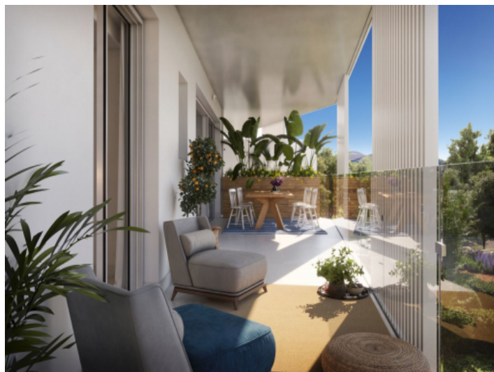
Tolle, überdachte Terrasse