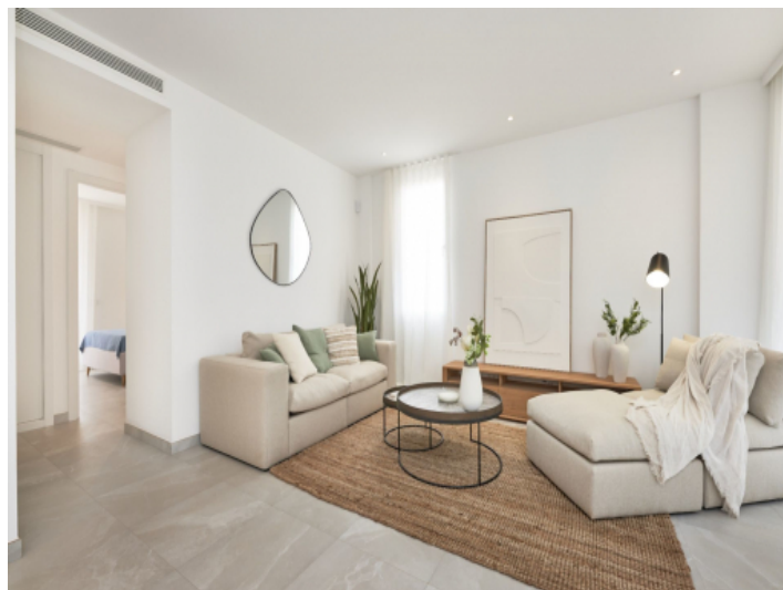
Weitere Ansicht des Wohnbereichs