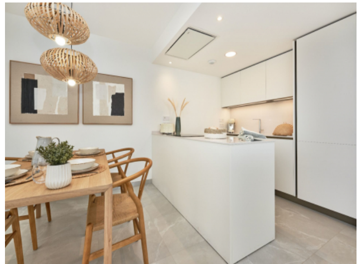
Moderne Küche mit angrenzendem Essbereich