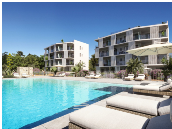
Außenansicht mit Poolbereich