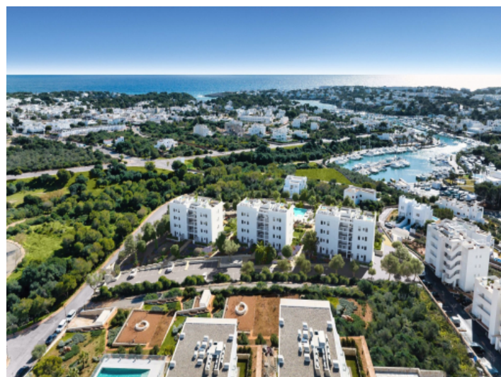
Wohnanlage aus der Vogelperspektive