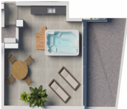
Grundriss der Terrasse