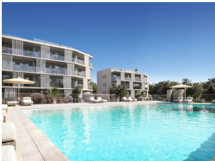
Wohnung, Cala d'Or