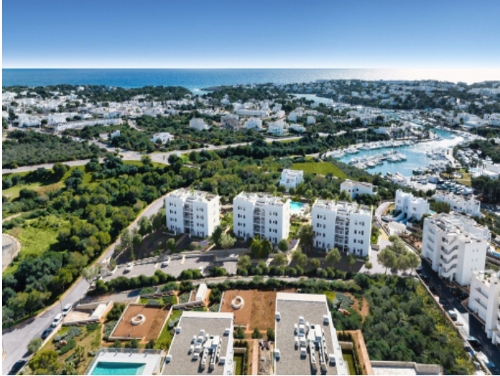
Wohnanlage aus der Vogelperspektive