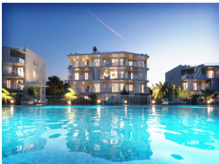
Wohnanlage bei Dämmerung