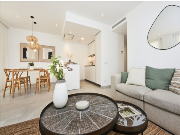
Offen gestalteter Ess- und Küchenbereich