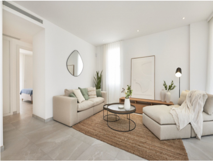
Weitere Ansicht des Wohnbereichs