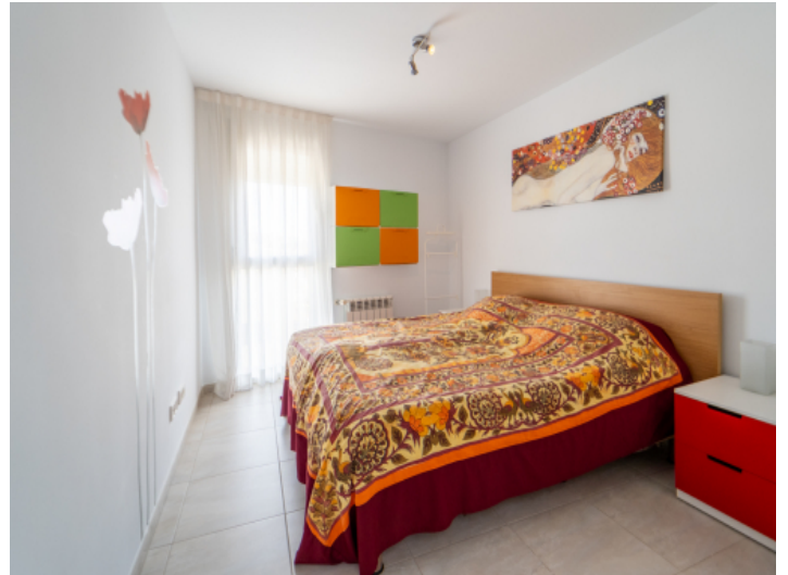
Wohnung mit einem Schlafzimmer