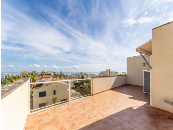
Dachterrasse mit Meerblick