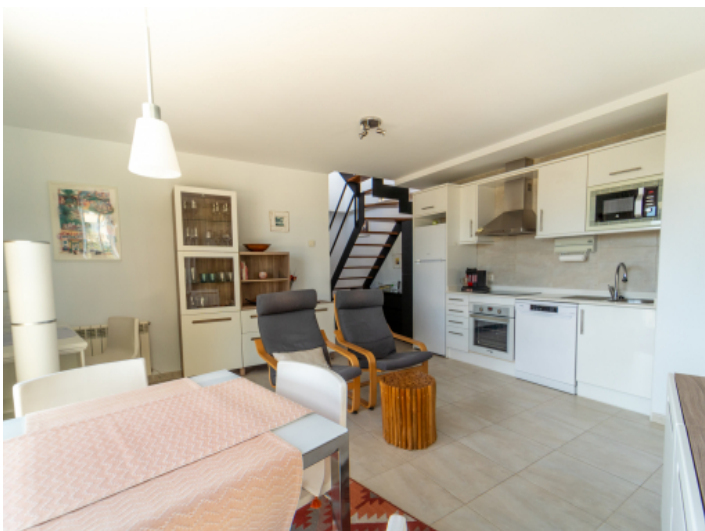
Wohn, Ess- und Küchenbereich