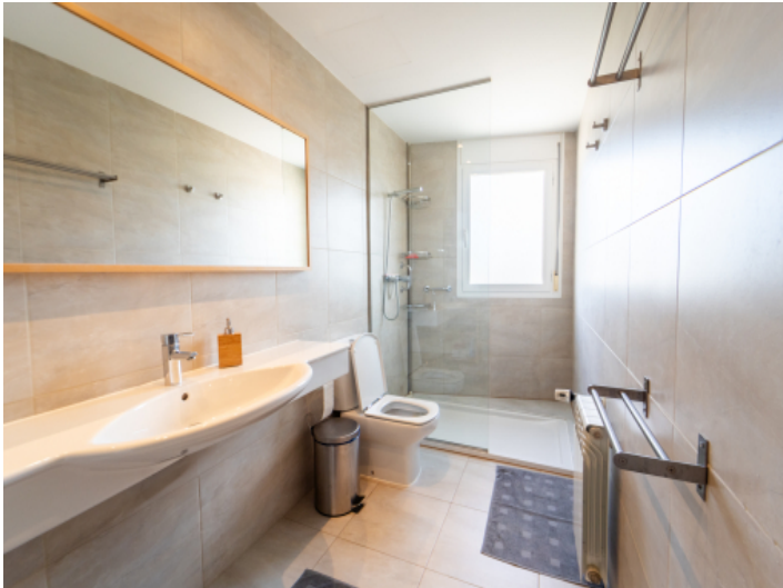
Badezimmer mit bodentiefer Dusche