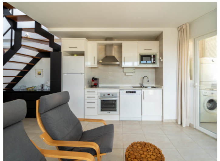
Wohn, Ess- und Küchenbereich