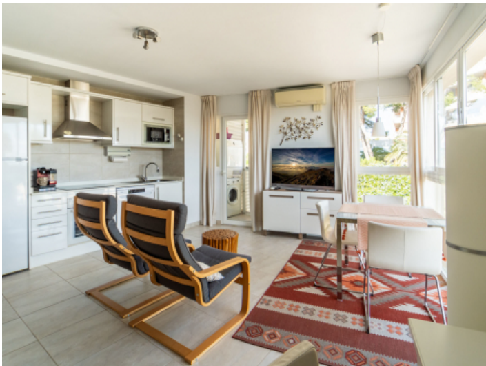
Wohn, Ess- und Küchenbereich