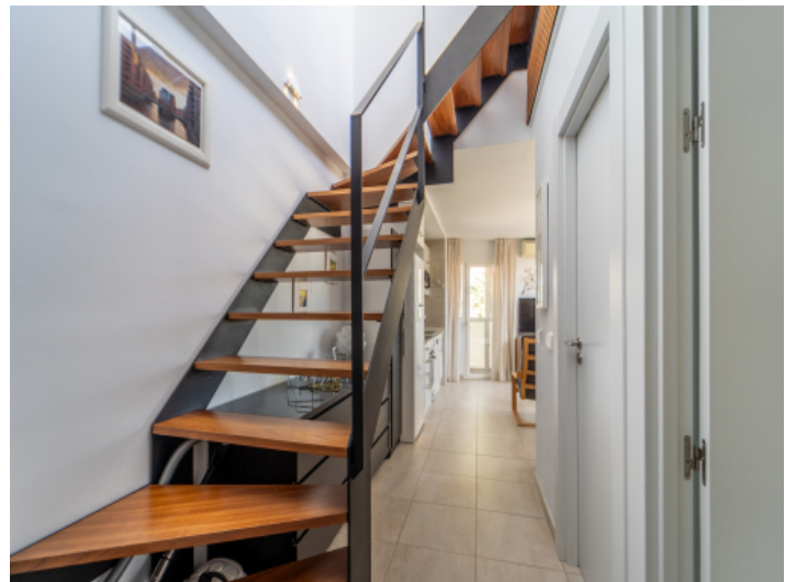
Treppe zur Dachterrasse