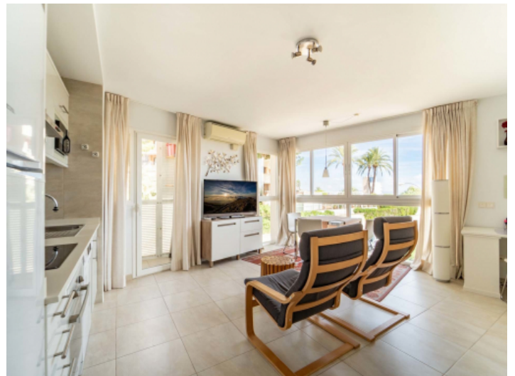
Wohn, Ess- und Küchenbereich