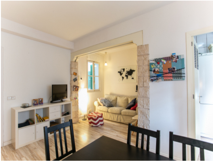
Blick in den gemütlichen Wohnbereich