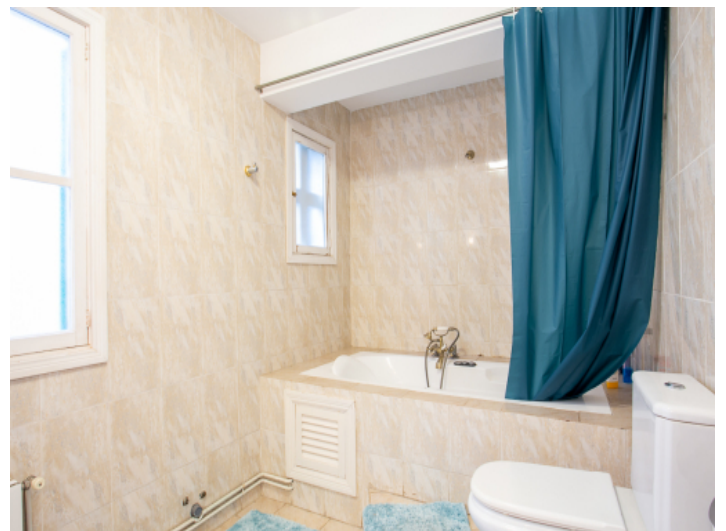
Badezimmer mit Wanne