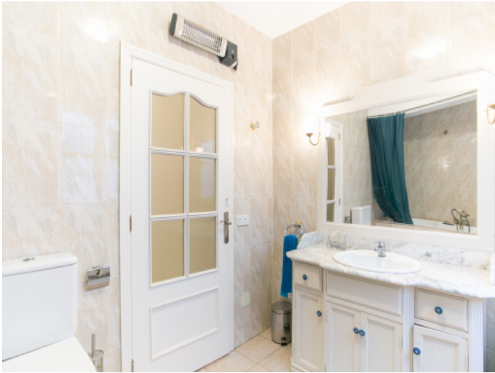
Alternative Ansicht des Badezimmers