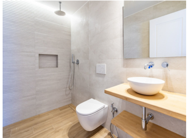
Erdgeschosswohnung mit 2 Badezimmern