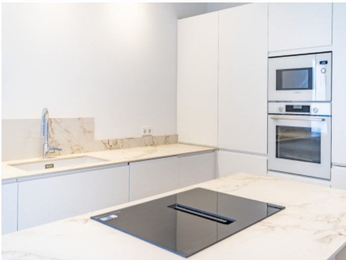
Küche mit Kochinsel