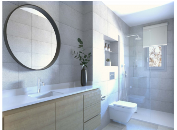
Die Wohnung verfügt über 2 Badezimmer