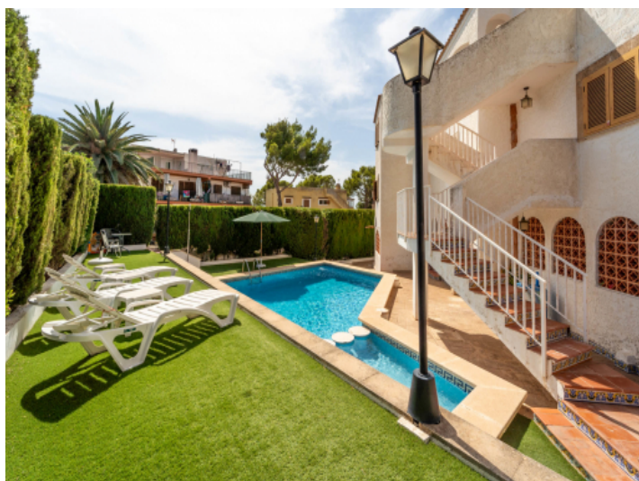
Garten und Pool