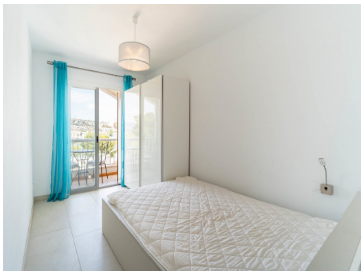
Eines von 3 Schlafzimmern