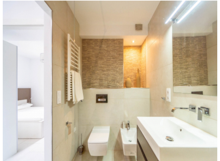
Das 2. Badezimmer