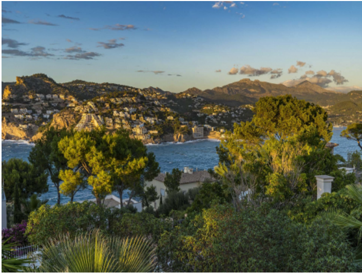
Blick auf Port Andratx