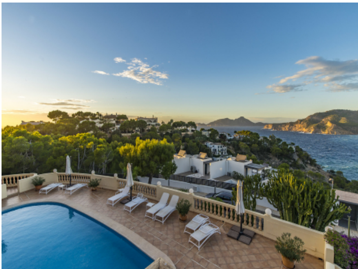
Blick über den Pool am Abend