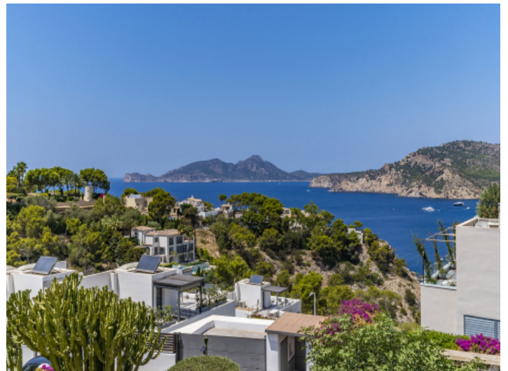
Blick aufs Meer und Dragonera