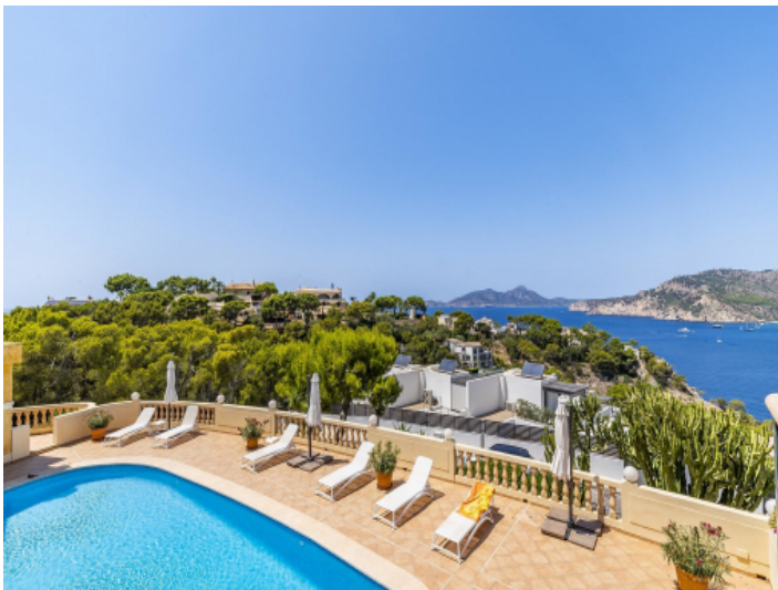
Blick über den Poolbereich aufs Meer