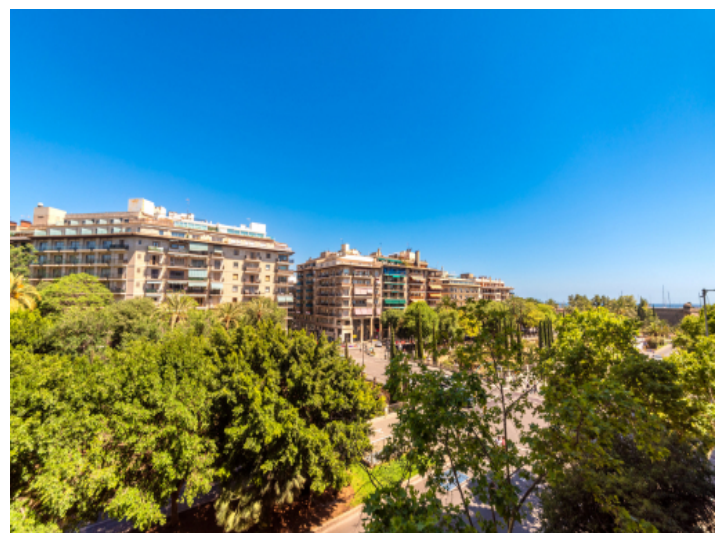
Blick über Santa Catalina