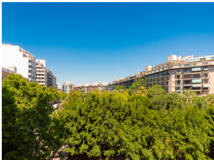
Blick über Santa Catalina