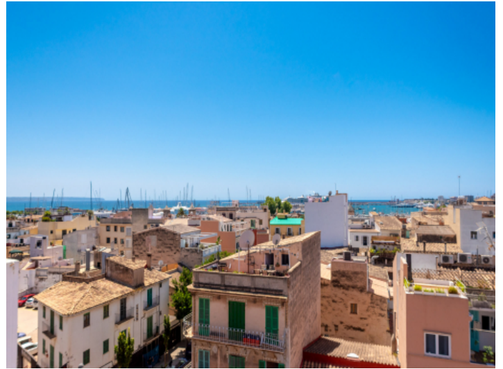
Blick bis hin zum Meer