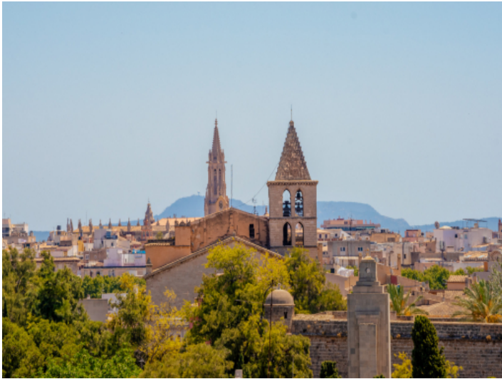
Mit Blick auf die Kathedrale