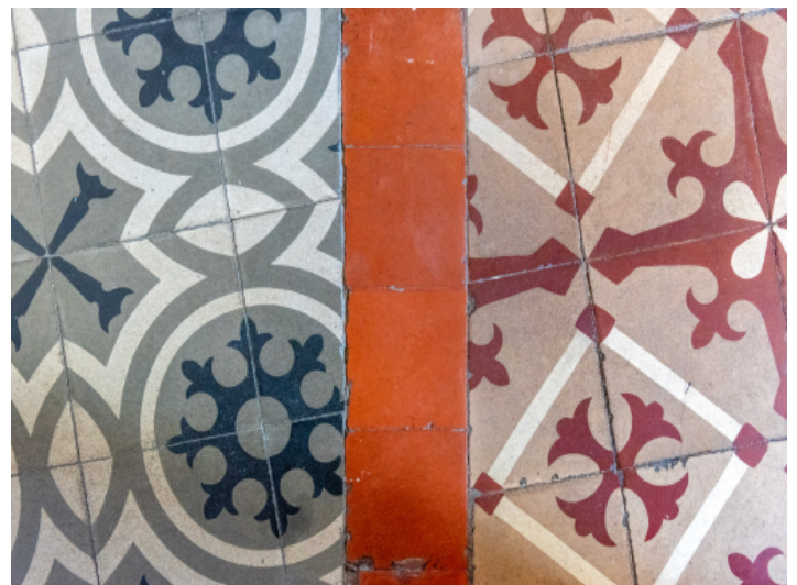
Fantastische alte Fliesen