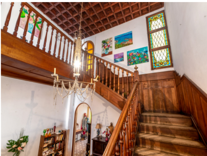
Treppenhaus und sehr hohe Decken