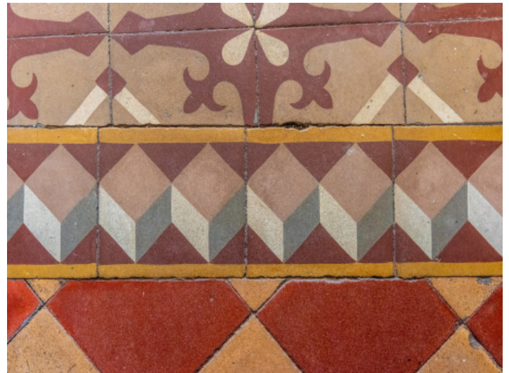
Original mallorquinischer Fussboden