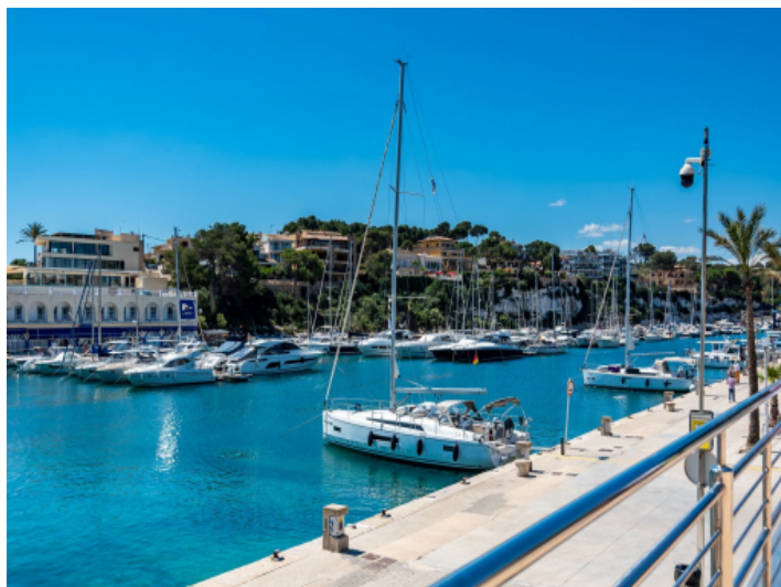
Yachthafen von Porto Cristo