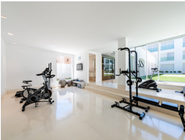
Fitnessraum im Gemeinschaftsbereich