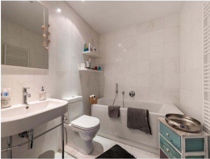
Ein weiteres Badezimmer