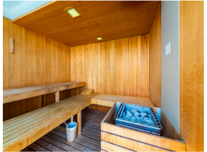
Sauna im Gebäude