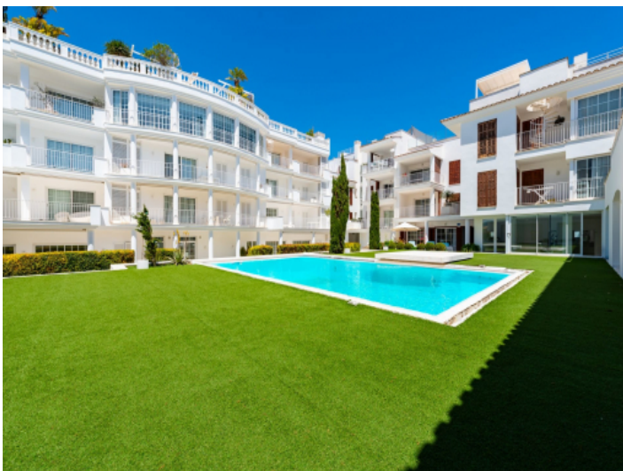
Sehr gepflegte Aussenanlagen