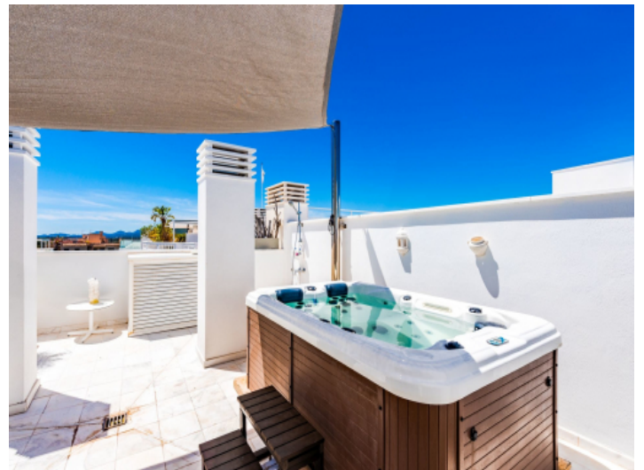
Jacuzzi auf der privaten Dachterrasse