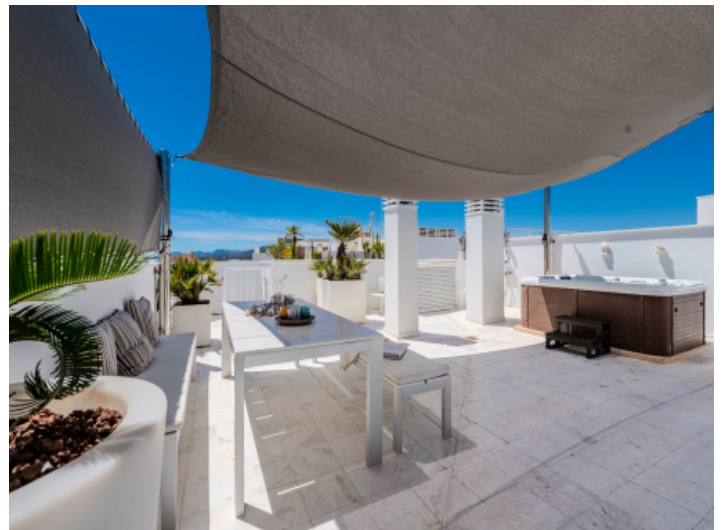
Private Dachterrasse mit Jacuzzi