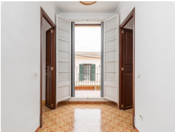
Balkon und Flur zu den 2 Schlafzimmern