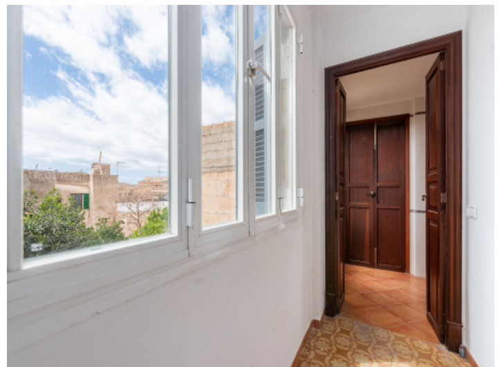
Der Flur verbindet Küche , Wohnberreich und Badezimmer