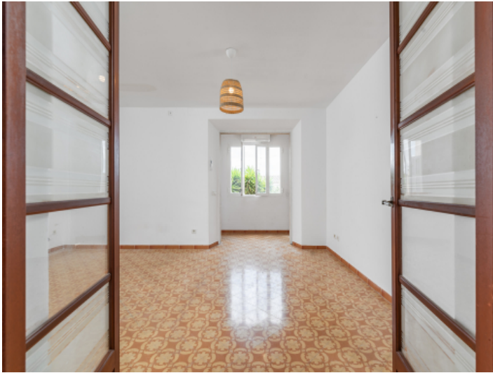
Blick in den Wohnbereich