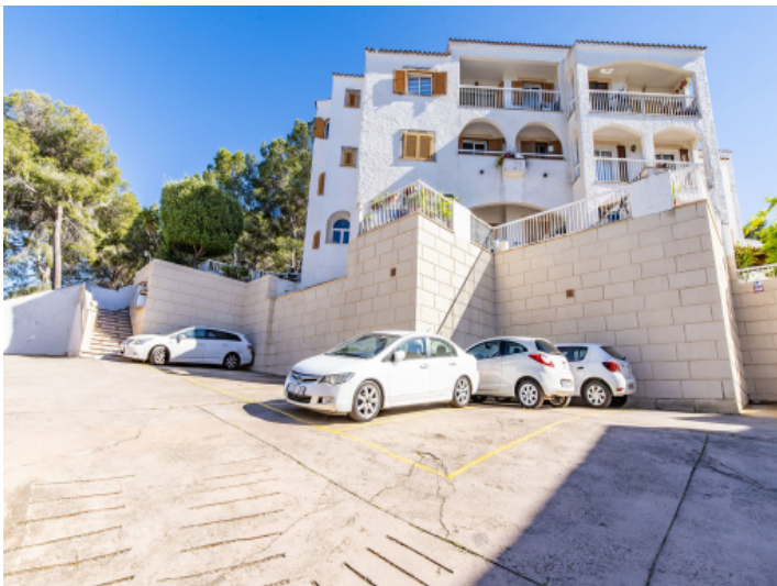
Stellplatz und Fassade