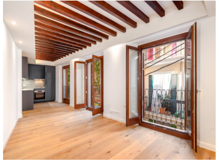
Helle Neubauwohnung in hervorragender Lage in der Altstadt