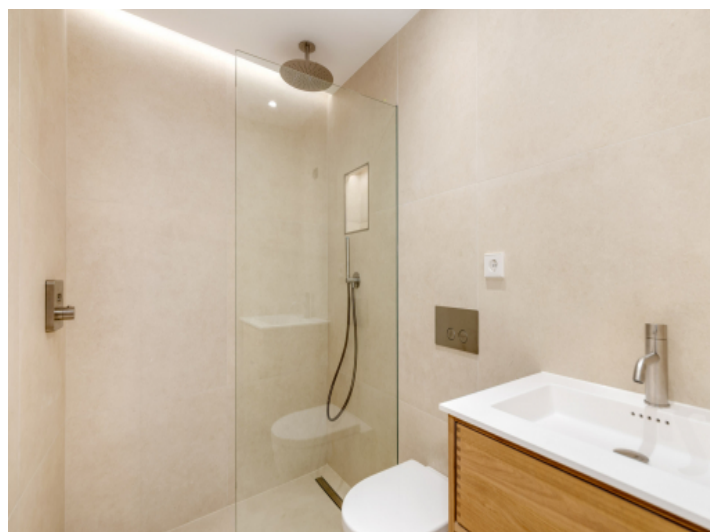
Badezimmer mit bodentiefer Dusche