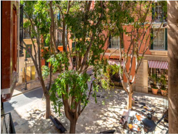
Aussicht aus der Wohnung