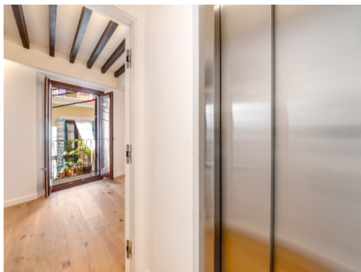
Aufzug direkt in die Wohnung