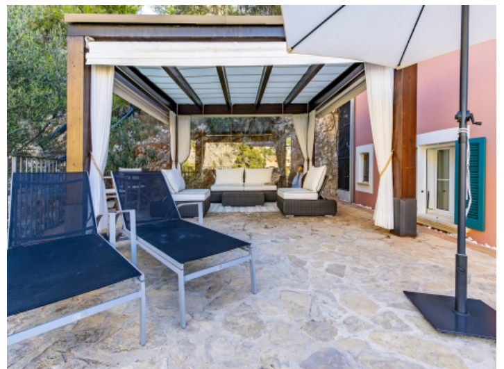
Loungebereich auf der Terrasse