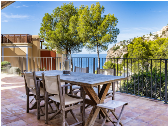
Essbereich im Freien