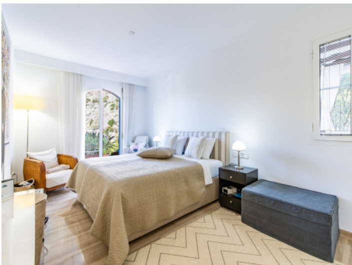
Eines von 2 Schlafzimmer