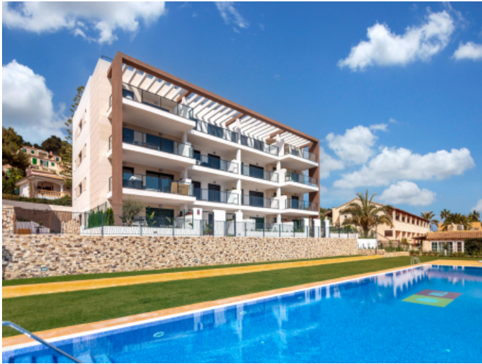
Wohnhaus und Poolbereich