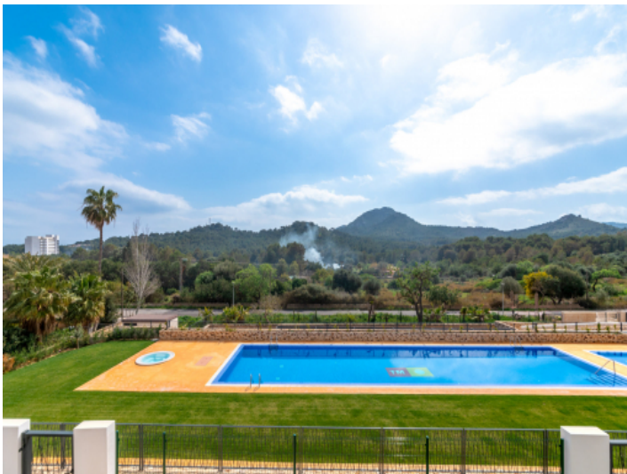
Pool und Ausblick