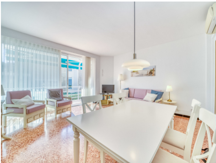
Heller Wohn- und Essbereich