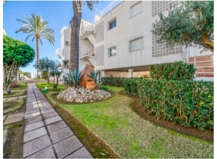
Aussenansicht des Gebäudes