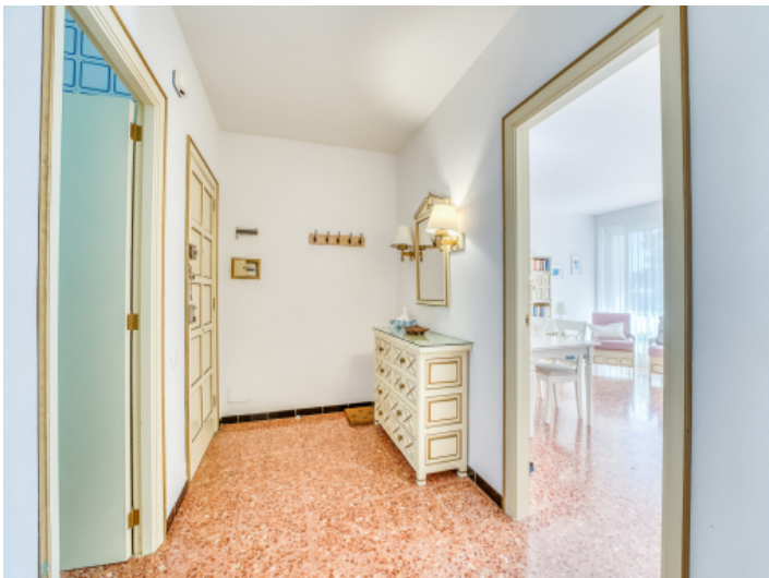
Eingangsbereich der Wohnung