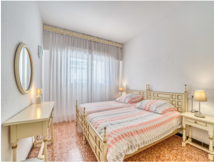
Das 2. Schlafzimmer