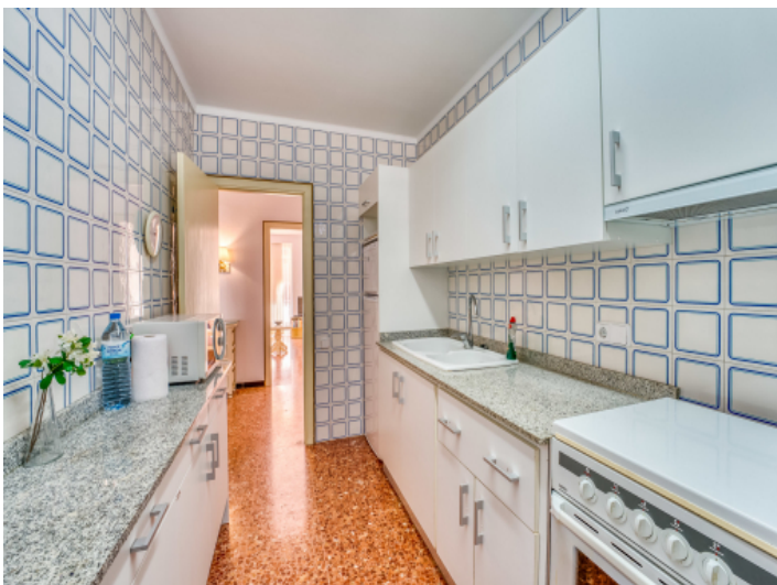
Die separate Küche