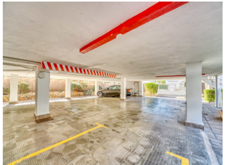
Ein Stellplatz im Gebäude