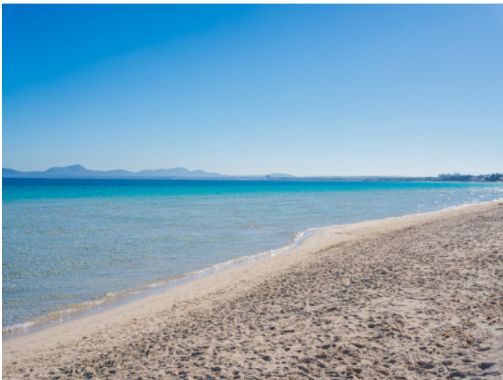
Der fantastische Strand von Alcudia