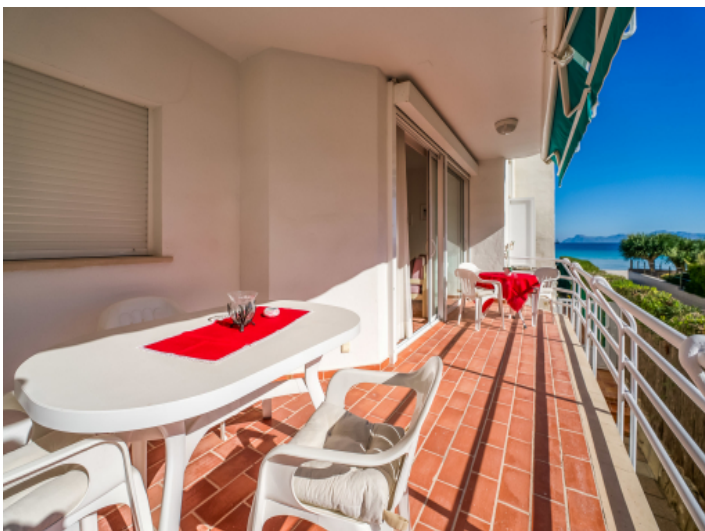
Essbereich auf dem schönen Balkon