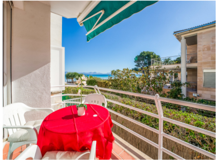
Seitlicher Meerblick vom Balkon