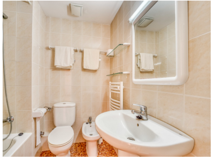
Ein komplettes Bad