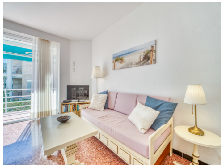
Eine Immobilie mit Strandlage