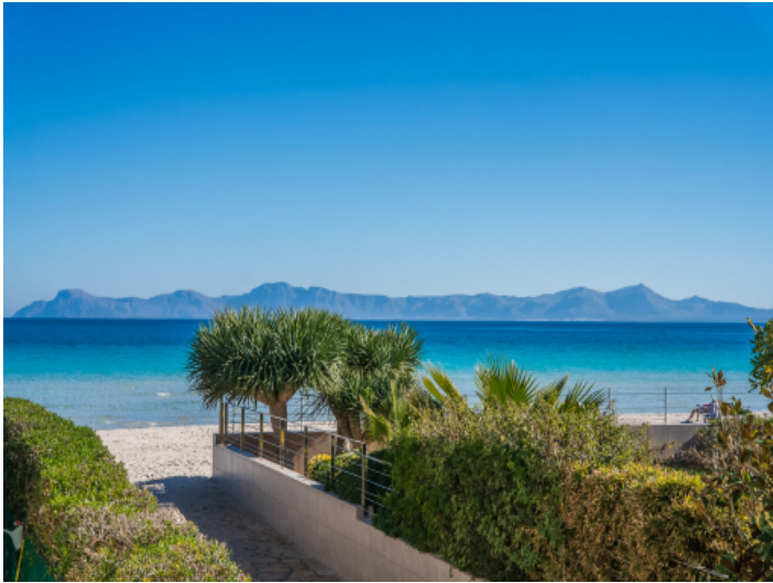
Der feine Sandstrand in Playa de Alcudia