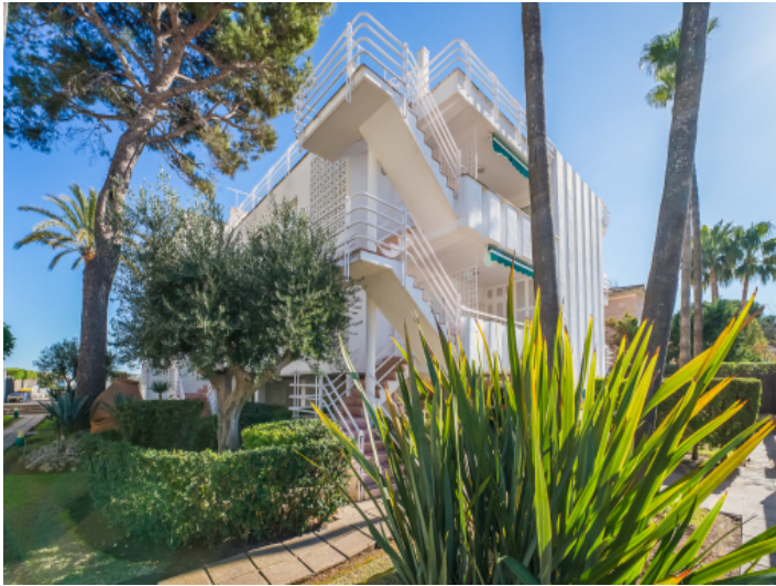
Aussenansicht des Gebäudes mit seinen 18 Wohneinheiten