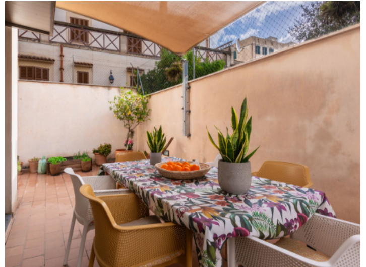
Terrasse mit Essbereich