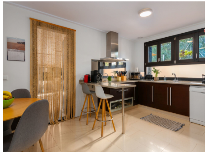
Großzügige Küche mit Essbereich