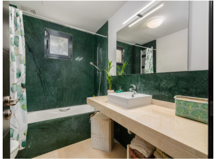
Badezimmer mit Badewanne