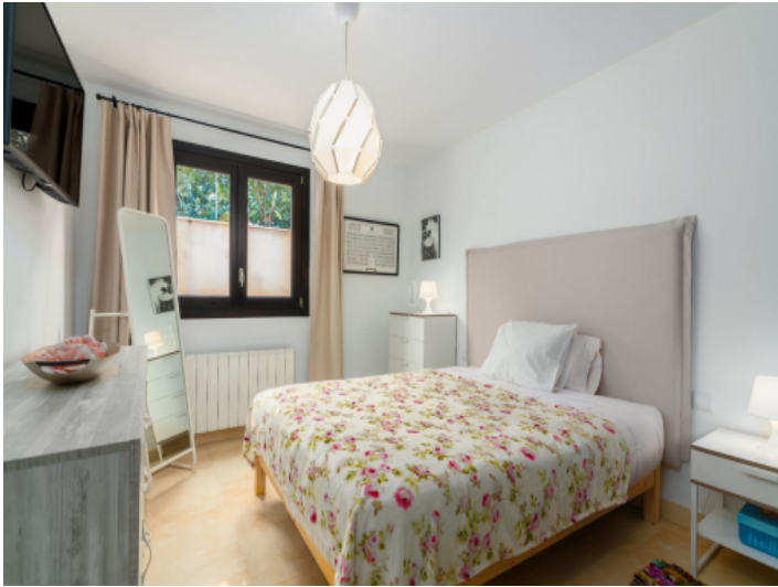
Schlafzimmer mit Heizung