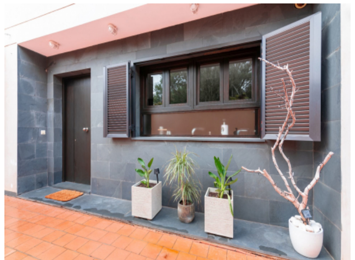
Eingangsbereich der Wohnung