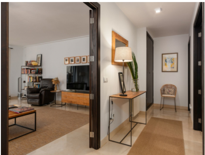
Flur der Wohnung