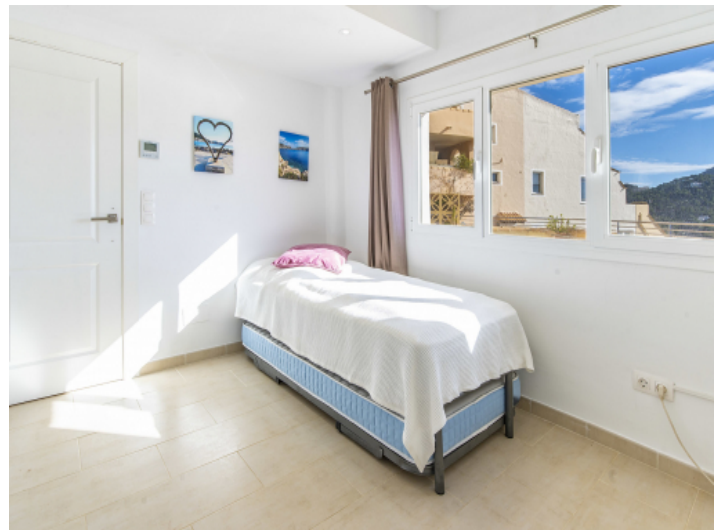
Eines von zwei Schlafzimmern