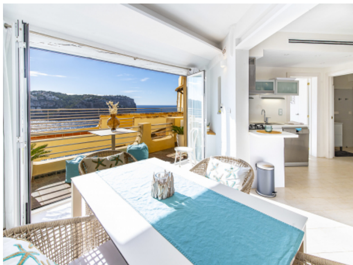
Essbereich mit Blick auf das Mittelmeer