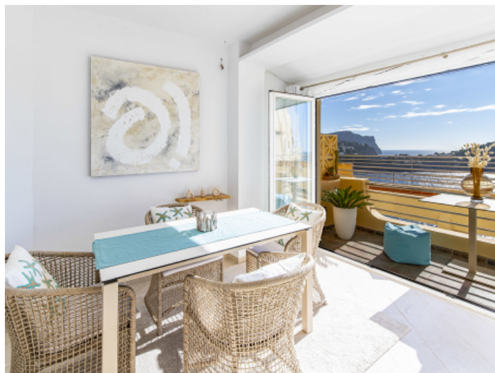
Essbereich mit Balkonzugang