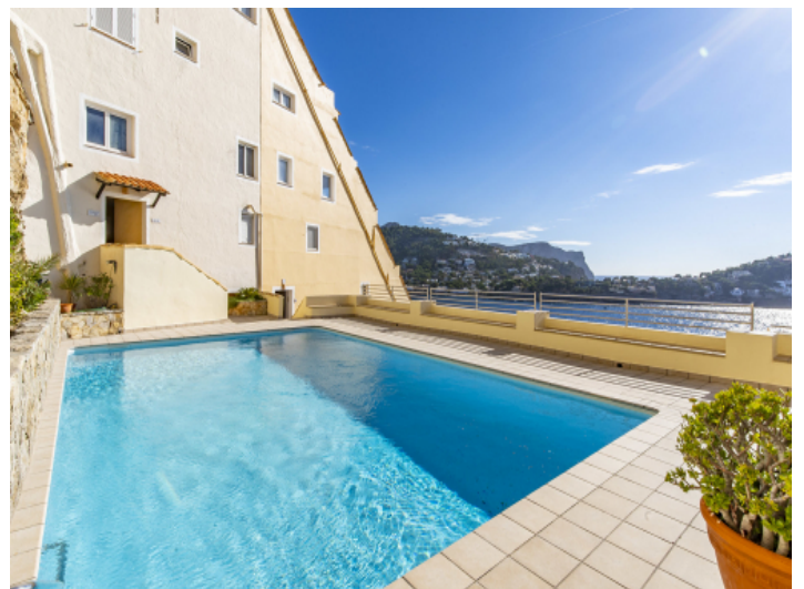
Der Gemeinschaftspool ist von einer Terrasse umgeben