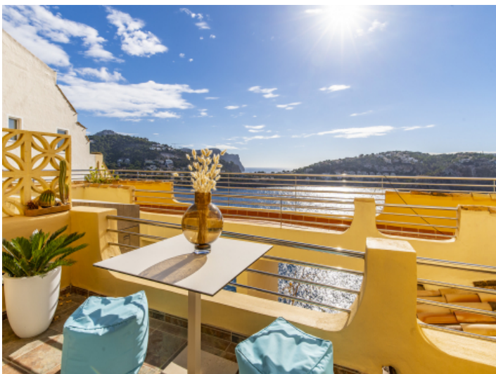
Blick über das Mittelmeer vom Balkon aus