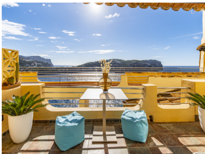
Toller Meer- und Bergblick