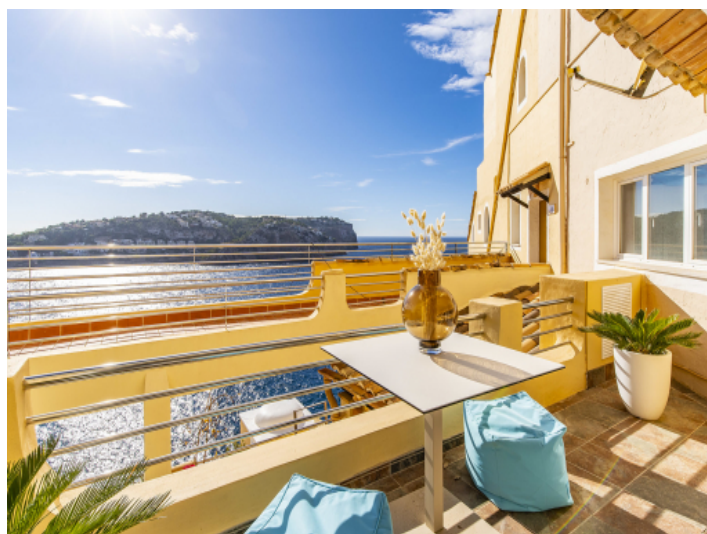
Herrlicher Meerblick vom Balkon aus