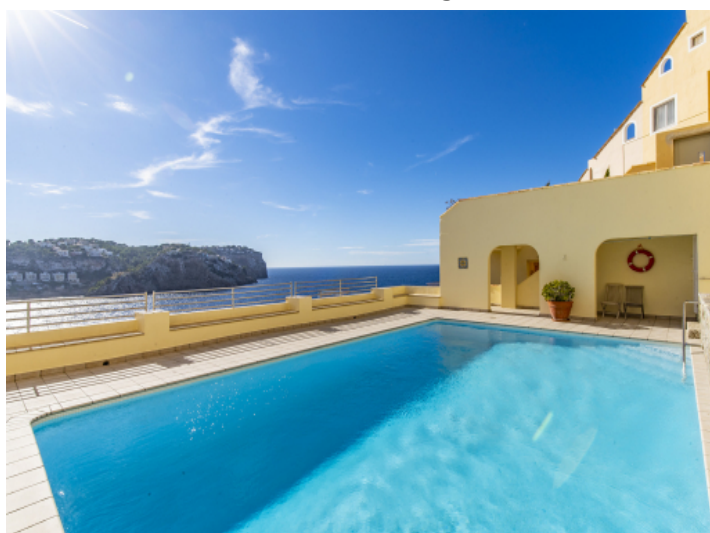
Gemeinschaftspool mit Meerblick