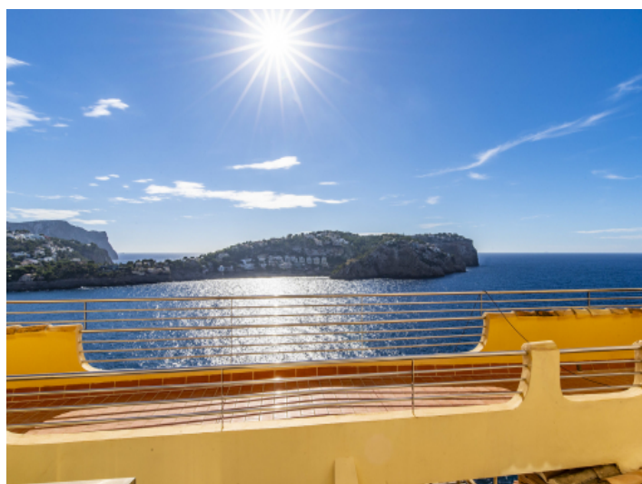
Wohnung mit privatem Meerzugang