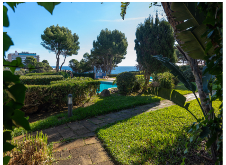
Parkähnlicher Garten der Anlage