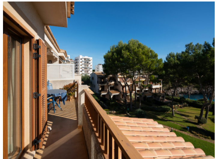
Sonnige Terrasse mit Weitblick