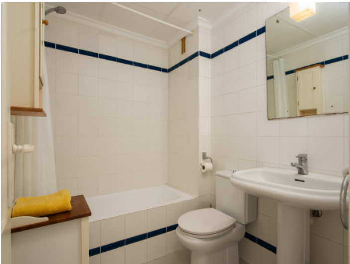
Badezimmer mit Badewann