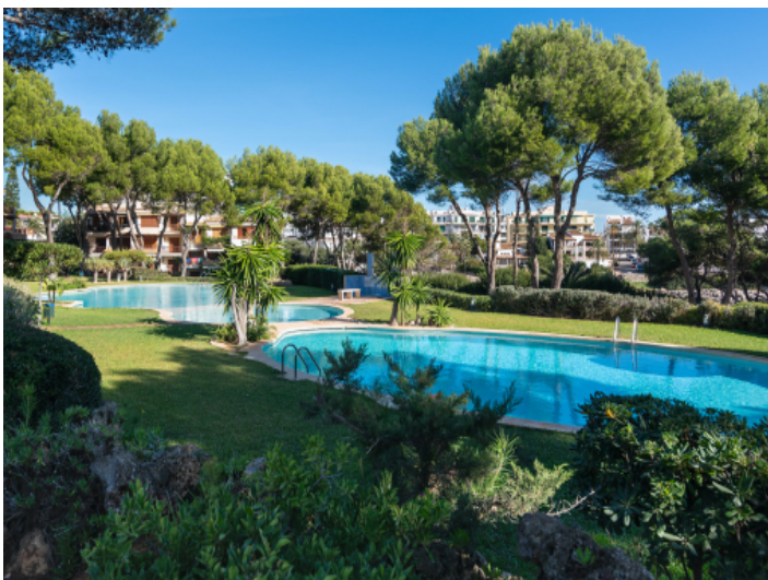
Sehr gepflegter Gemeinschaftsbereich