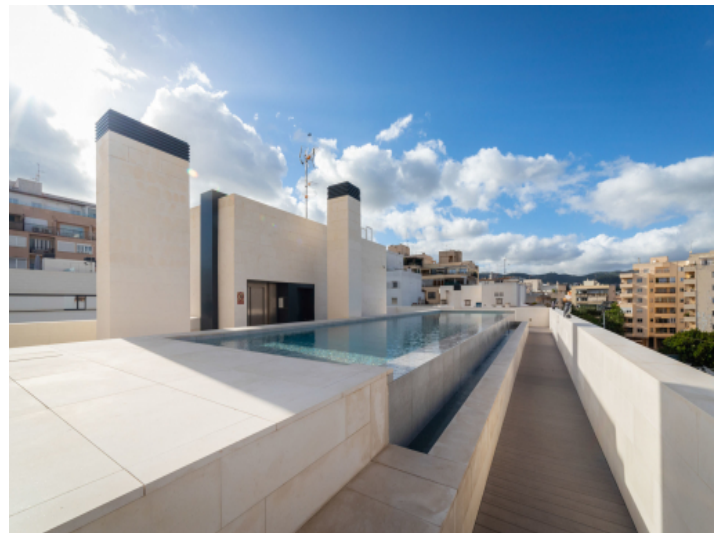
Dachterrasse mit Pool