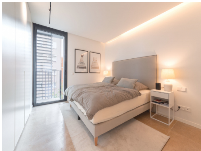
Schlafzimmer mit bodentiefen Fenstern