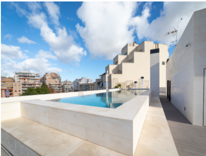
Der Pool ist von einer Terrasse umgeben