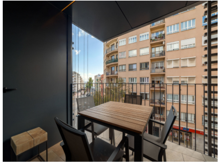
Balkon mit Blick in die Nachbarschaft