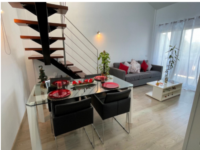
Wohn-/Essbereich mit direktem Balkonzugang