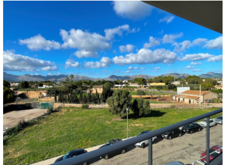
Schöner Weitblick bis zu den Bergen