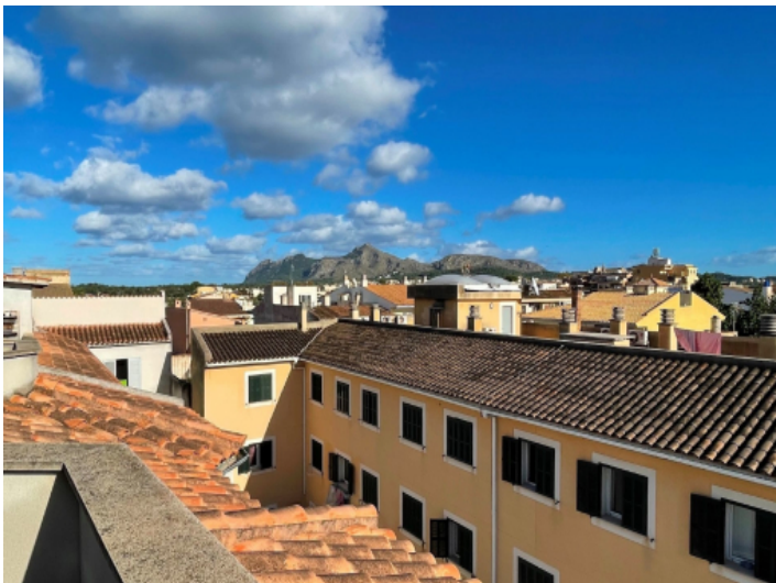
Blick von der Dachterrasse