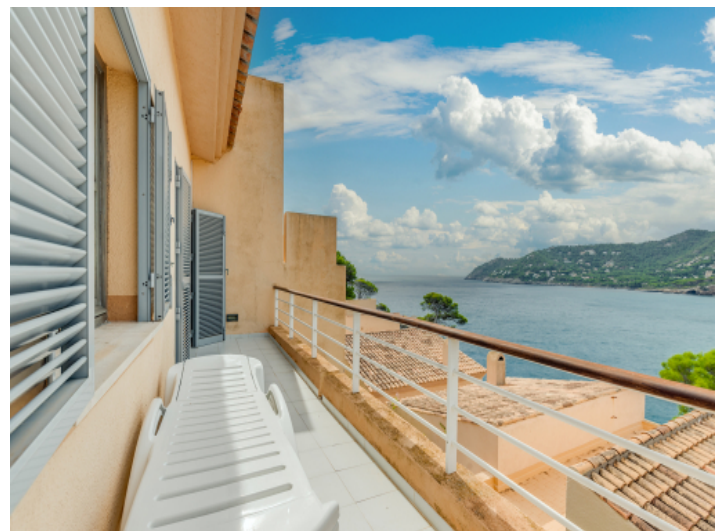
Blick vom Balkon in die Umgebung