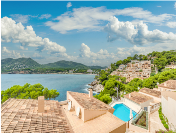
Blick in die Nachbarschaft