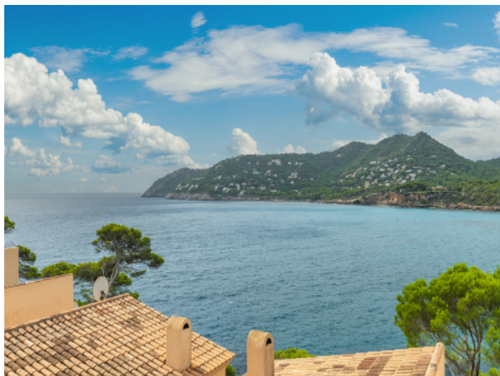
Blick auf das Mittelmeer vom Balkon