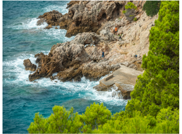
Blick zur Steilküste