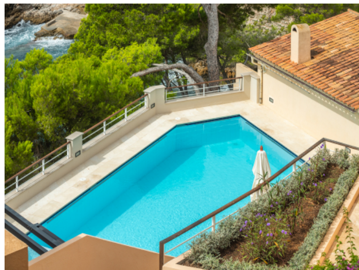
Blick auf den Pool vom Balkon