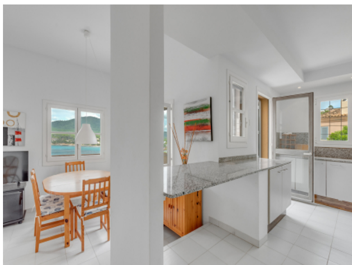
Blick von der Küche in den Essbereich