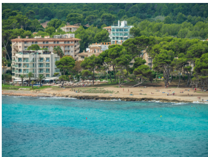
Blick auf den Strand vom Balkon