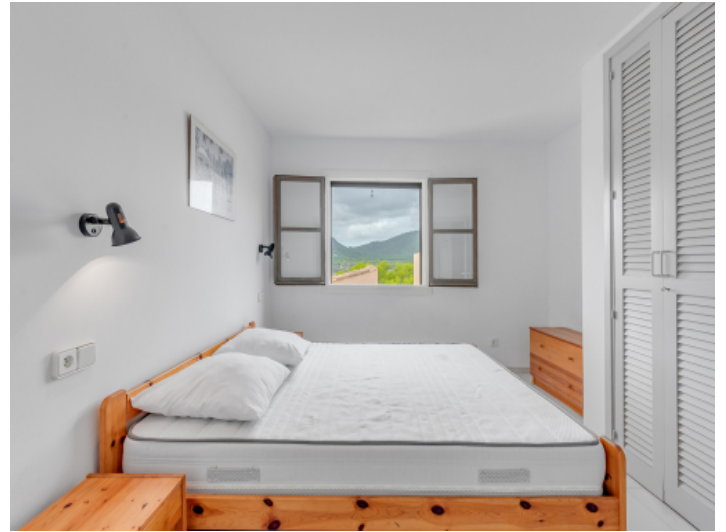
Meerblick vom Schlafzimmer aus