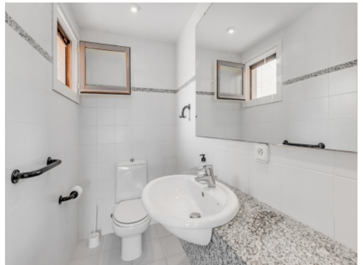
Badezimmer mit Tageslicht