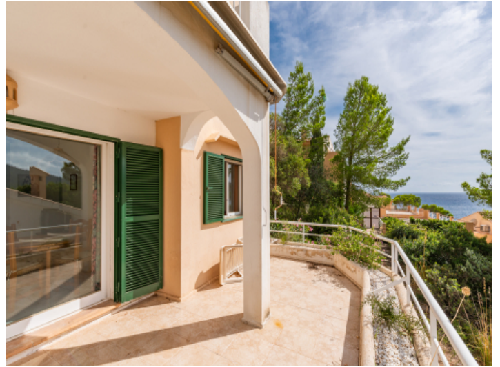
Terrasse mit Meerblick