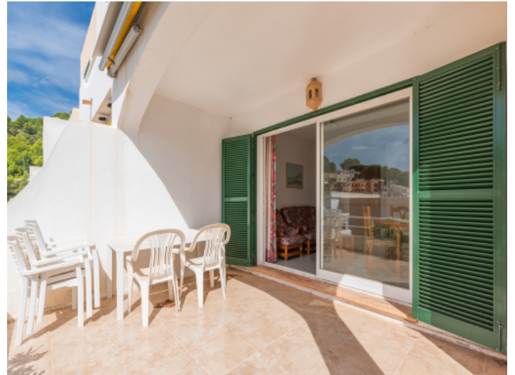
Große, überdachte Terrasse