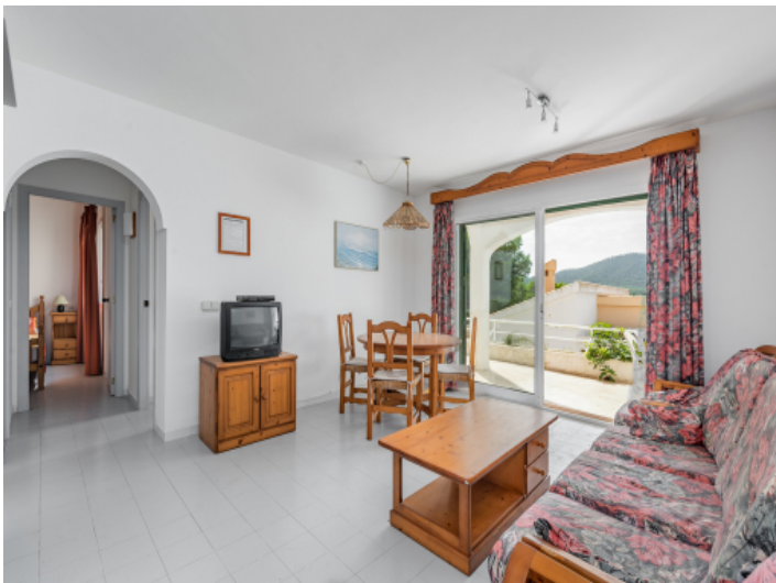
Wohnbereich mit Terrassenzugang