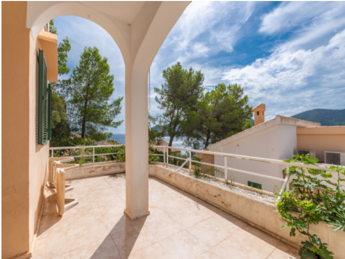
Meerblick-Wohnung mit Terrasse in Canyamel