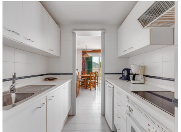
Voll ausgestatte Küche