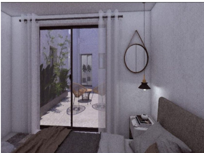
Schlafzimmer mit Blick in den Patio