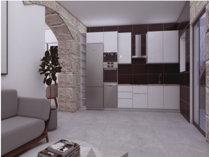
Offene Küche und Wohnbereich