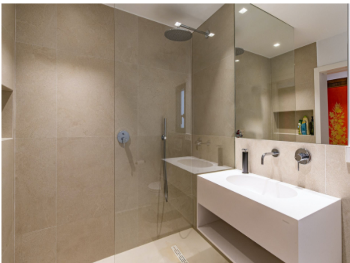
Eines von 2 Badezimmer