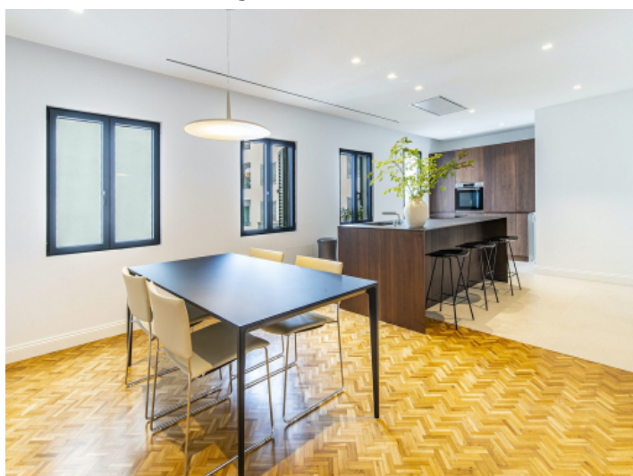
Offener Ess- und Küchenbereich