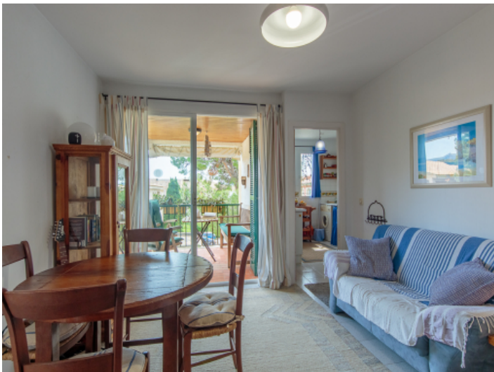
Wohnbereich mit Balkon