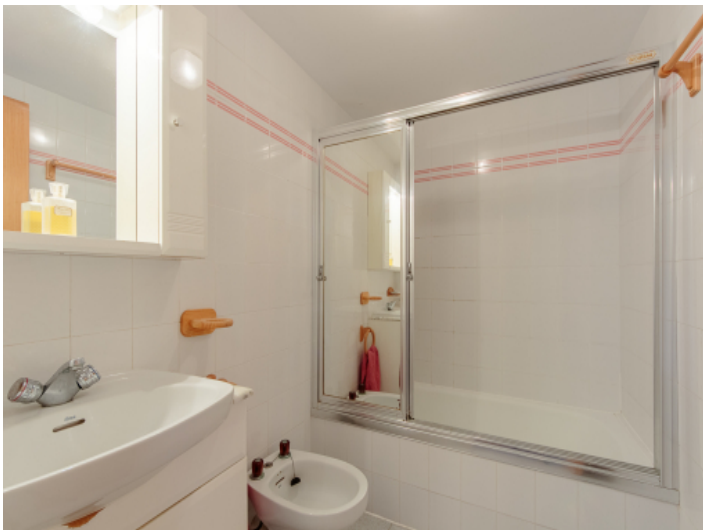
Badezimmer mit Wanne