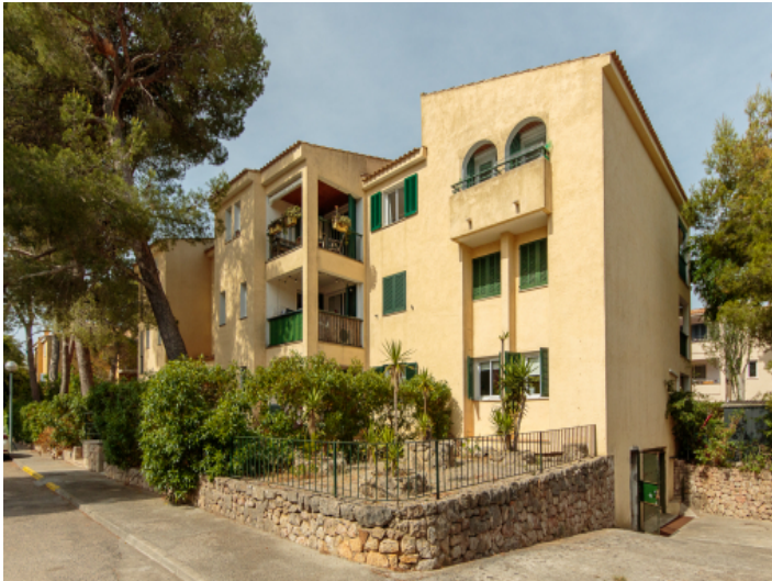
Ansicht des Gebäudes