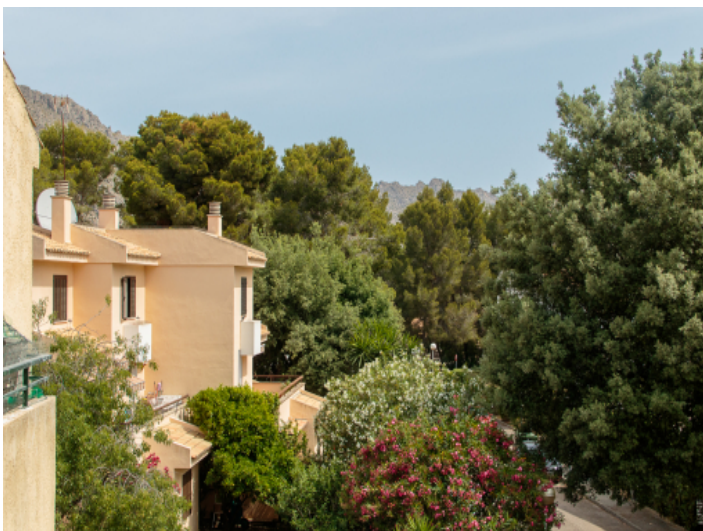
Blick von der Wohnung