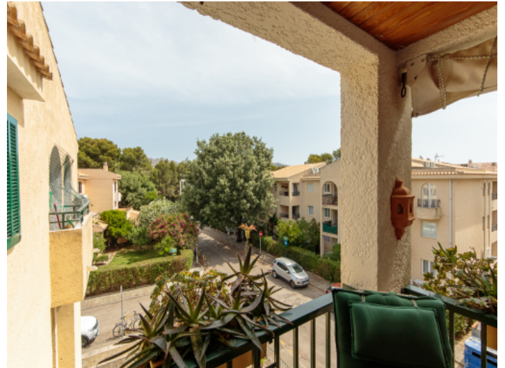
Blick von der Terrasse