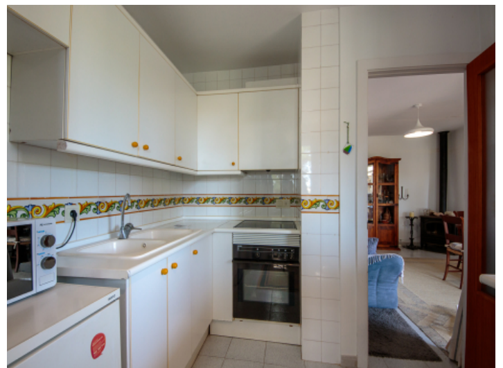
Zugang zum Wohnbereich