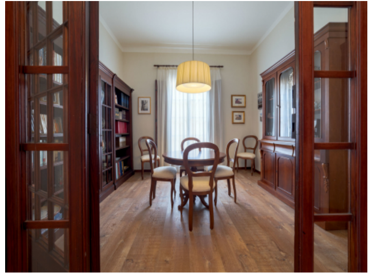
Esszimmer im klassischen Design