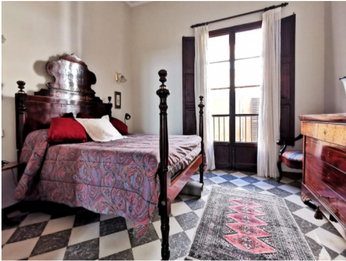
Eines von 3 Schlafzimmern