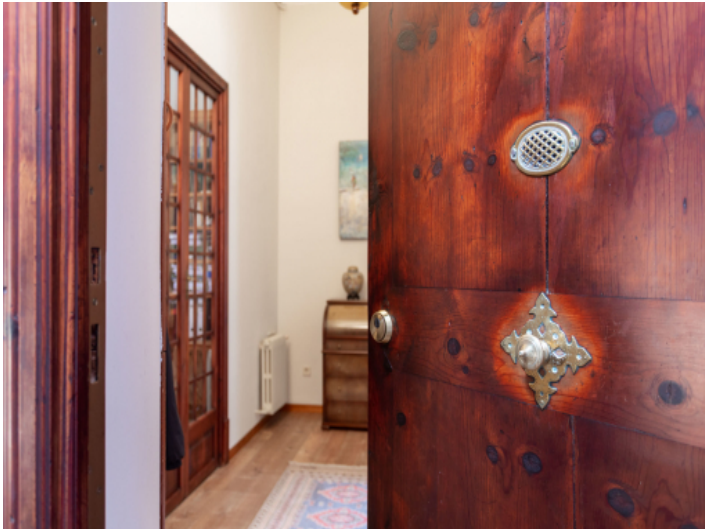
Charktervoller Eingang zur Wohnung