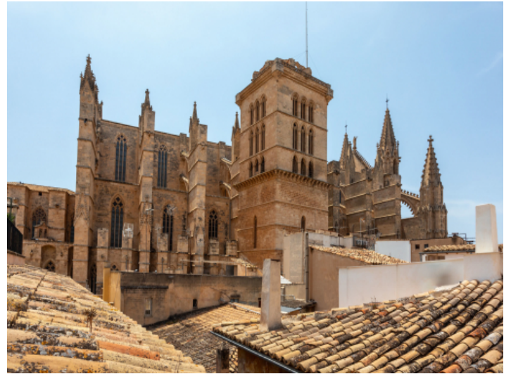
Blick auf die Kathedrale