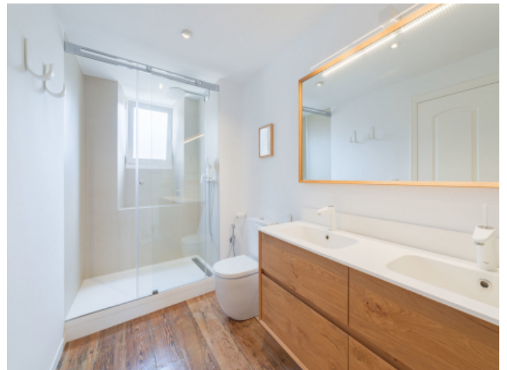
Eines von 3 Badezimmern