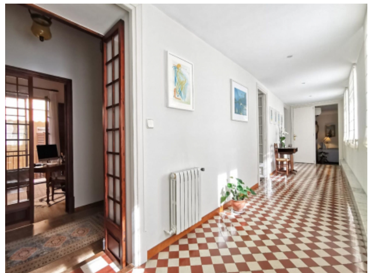
Sonnige, geräumige Wohnung in Palma mit einem besonderen mallorquinischen Charakter