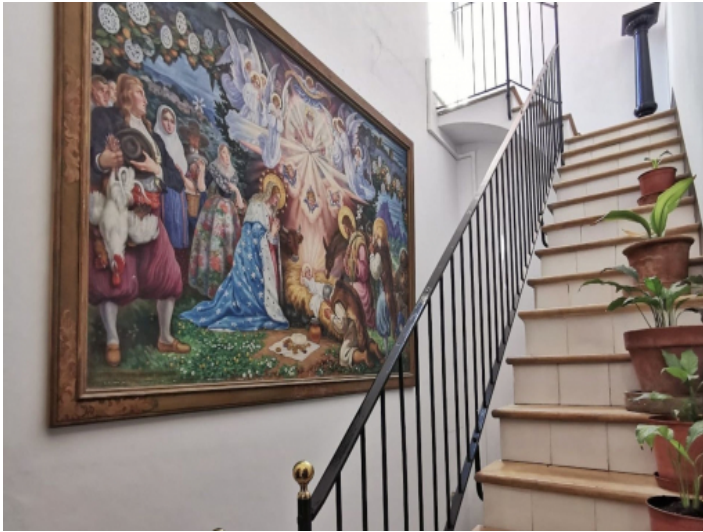
Zur Gemeinschaftsterrasse führende Treppe