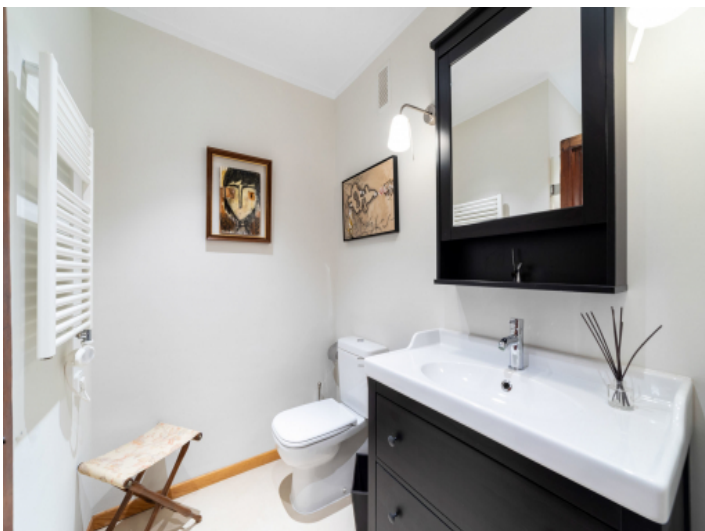
Eines von 3 Badezimmern