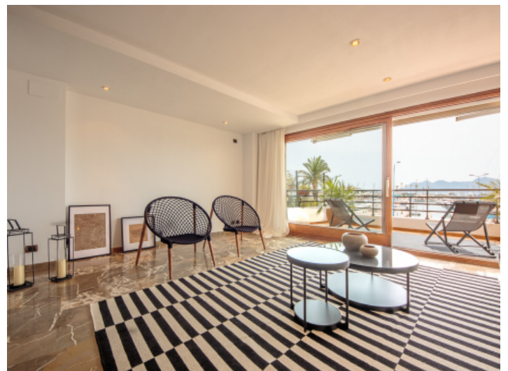
Wohnbereich mit Terrassenzugang