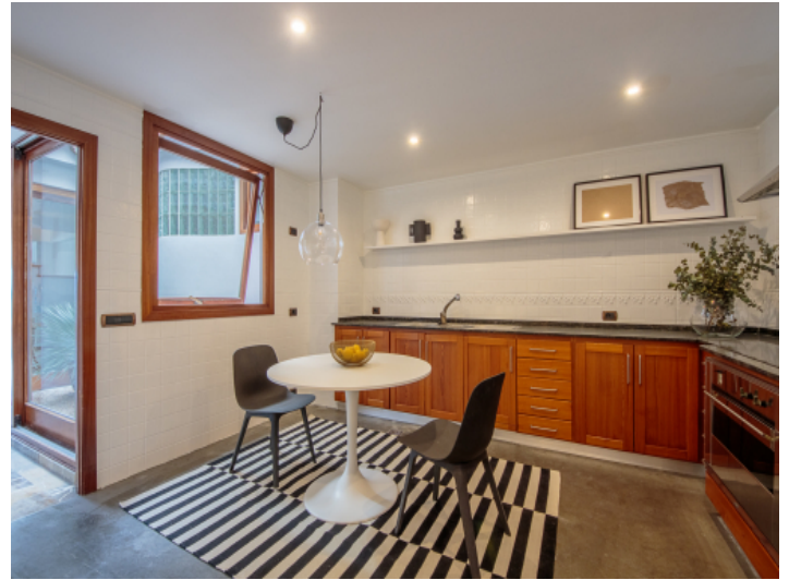
Komplett ausgestattete Wohnküche