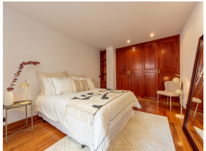
Geräumiges Schlafzimmer mit Einbauschränken