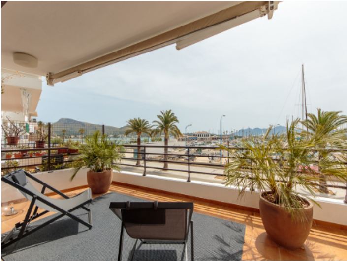
Geräumige Terrasse mit Hafenblick