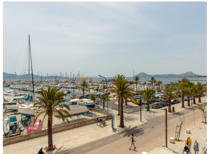
Blick über die Boote bis hin zum Meer