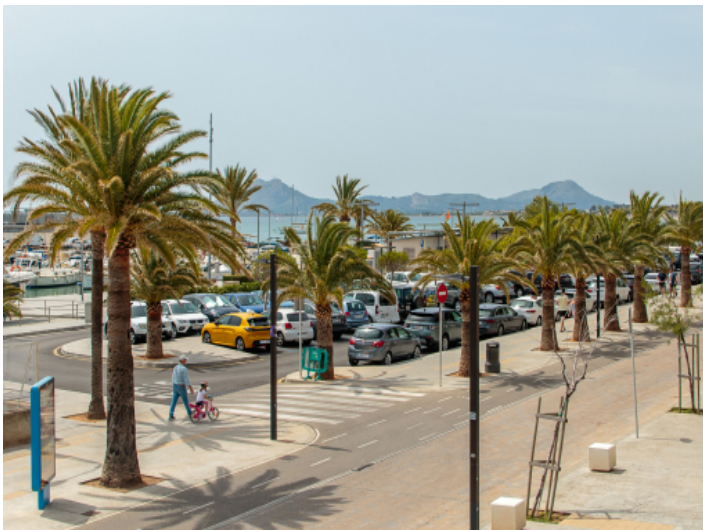
Blick über die Promenade