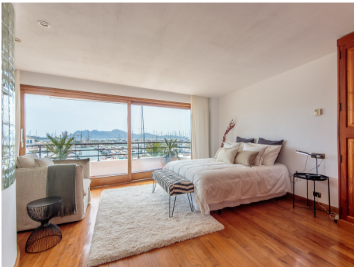
Exklusives Schlafzimmer mit toller Aussicht