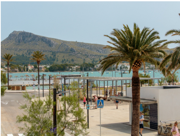
Toller Meer- und Bergblick