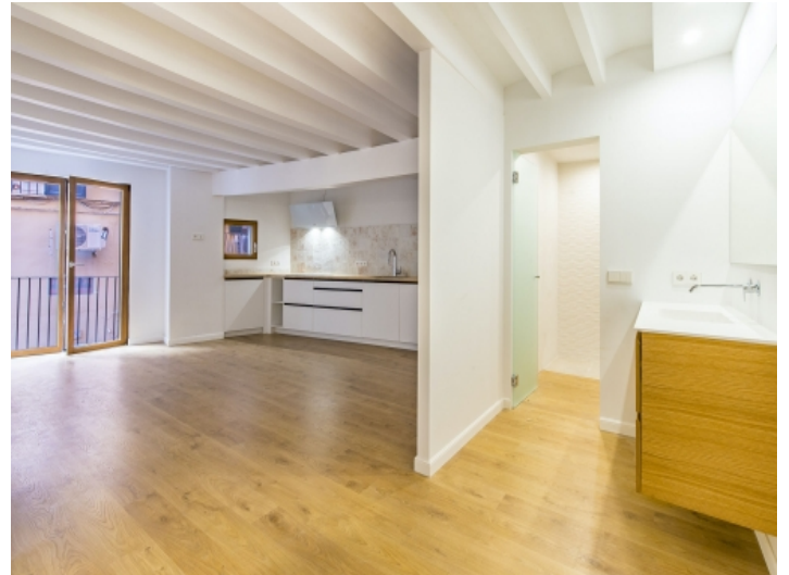
Offener Wohnbereich und Küche