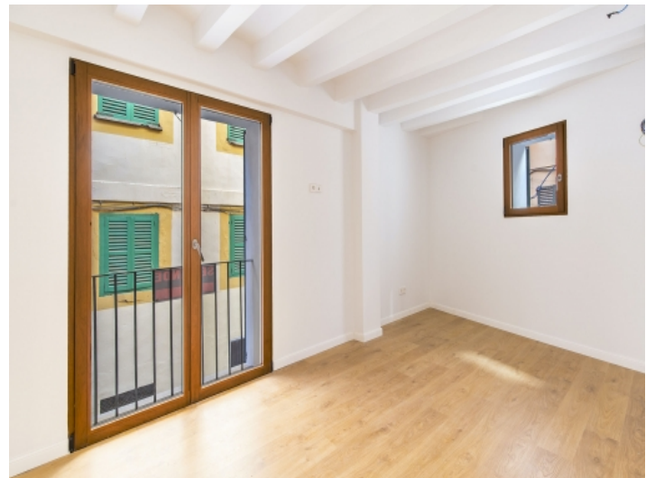
Ansicht des Schlafzimmers