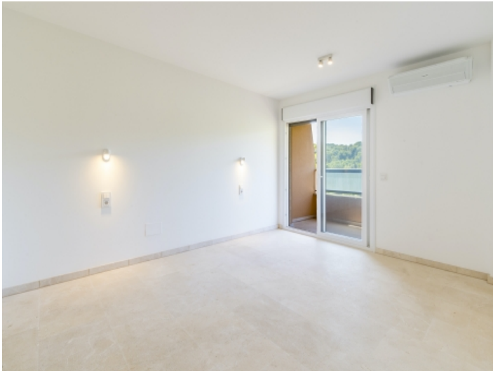
Eines von 2 Schlafzimmern