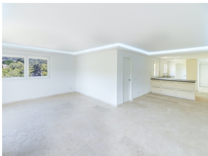
Blick zur Küche