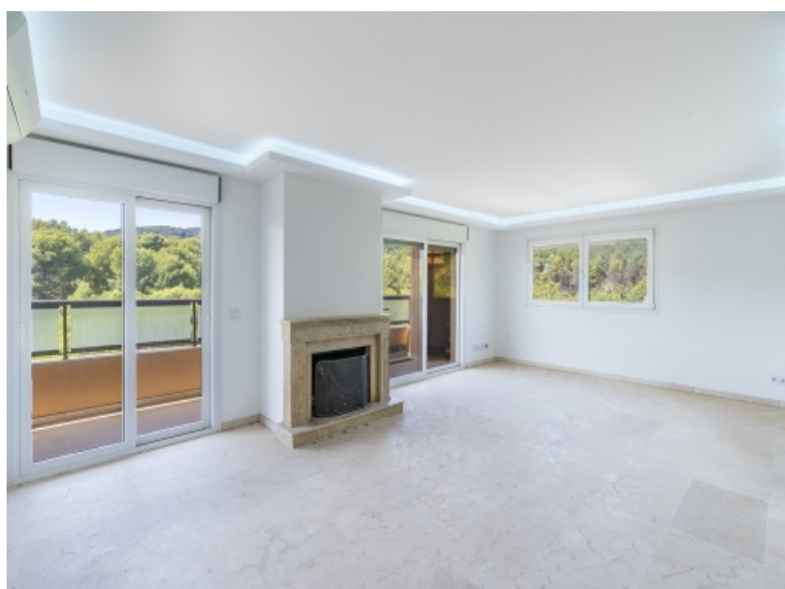
Wohnbereich mit Kamin