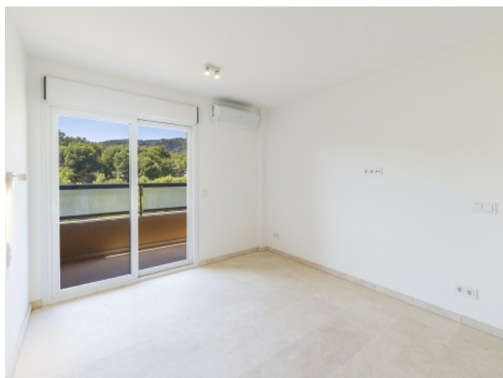
Eines von 2 Schlafzimmern