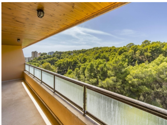
Balkon mit Ausblick in Grüne