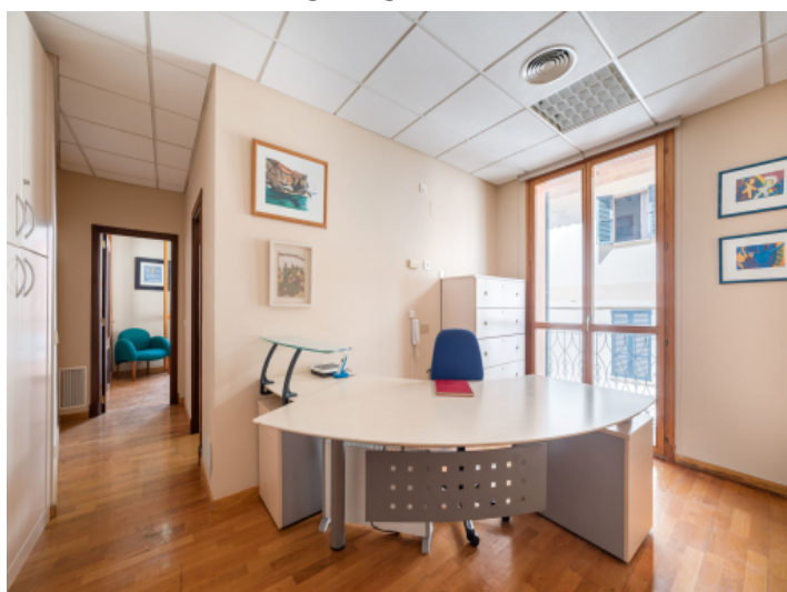
Ansicht der Wohnung