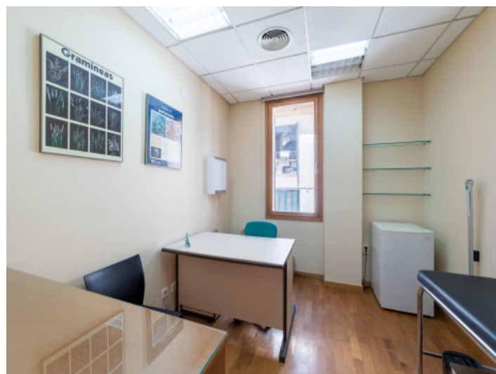
Ansicht der Wohnung