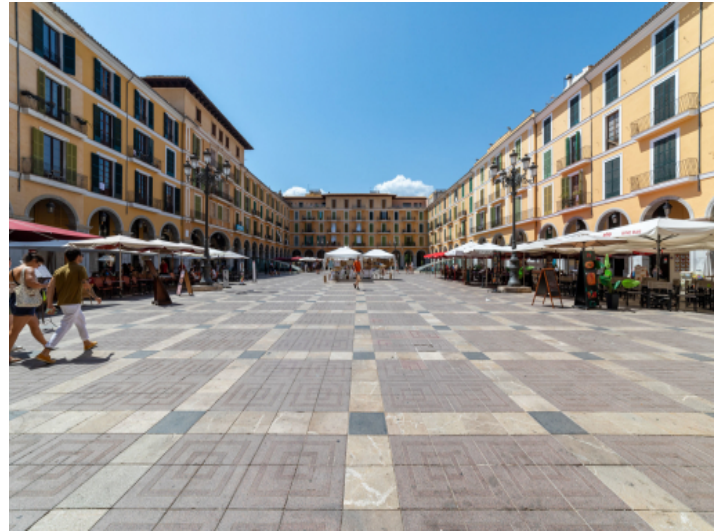
Umgebung der Wohnung