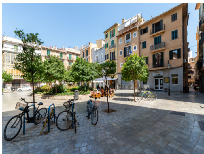
Umgebung von Palma