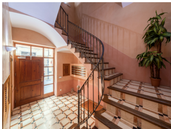
Eingang des Hauses