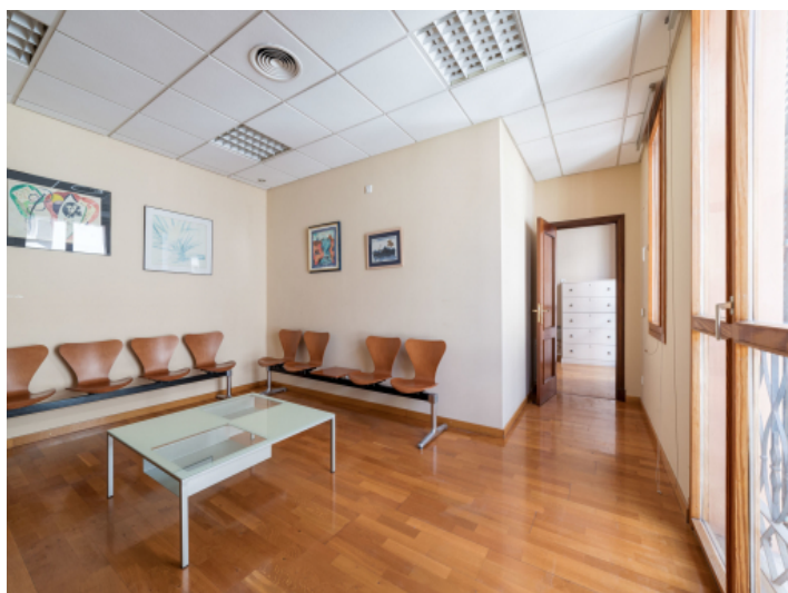
Ansicht der Wohnung