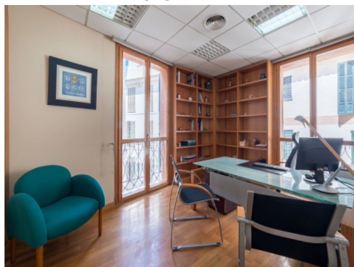
Ansicht der Wohnung