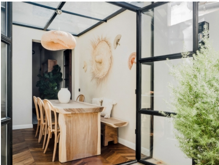
Blick in den Essbereich