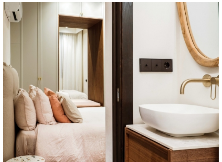
Nobles en Suite Badezimmer