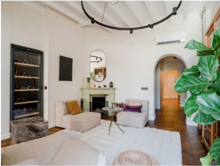
Eleganter Wohnbereich mit Kamin