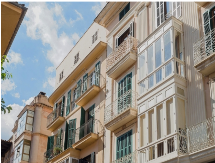
Ansicht des Gebäudes