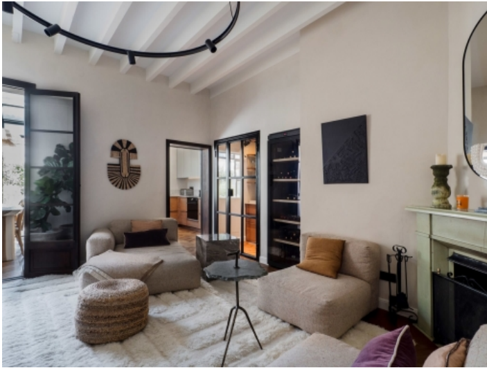
Wohnbereich mit Terrassen und Küchenzugang