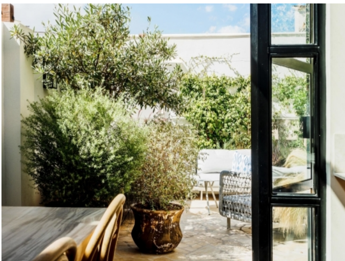
Zugang zur privaten Terrasse