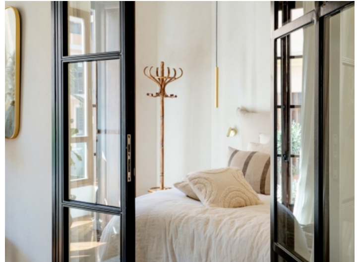
Eines von 3 Badezimmern