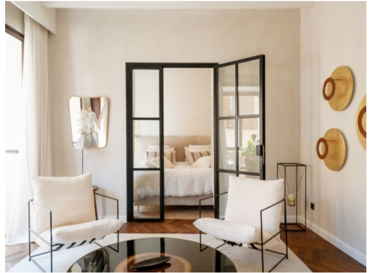
Luxuriöses Schlafzimmer mit Lounge