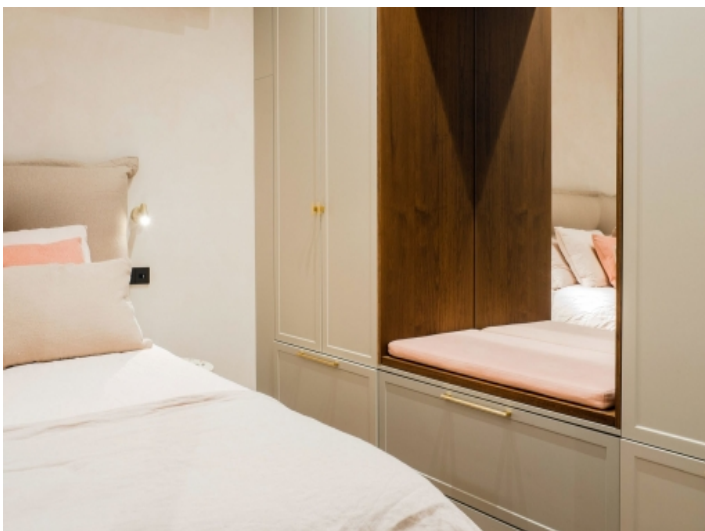
Eines von 3 Schlafzimmern