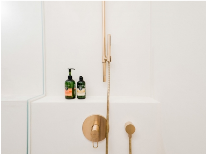
Eines von 2 Badezimmern