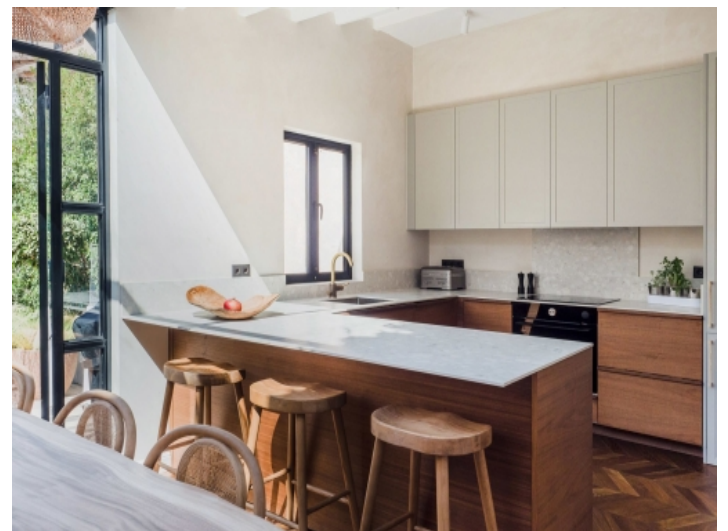
Moderne Küche mit Terrassenzugang