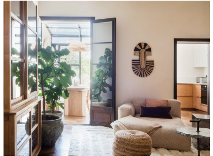
Zugang zum verglasten Essbereich