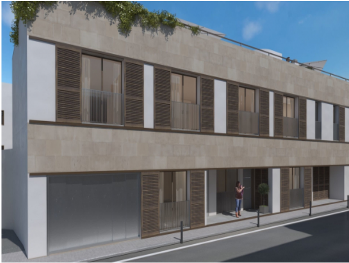
Außenansicht des Wohnhauses