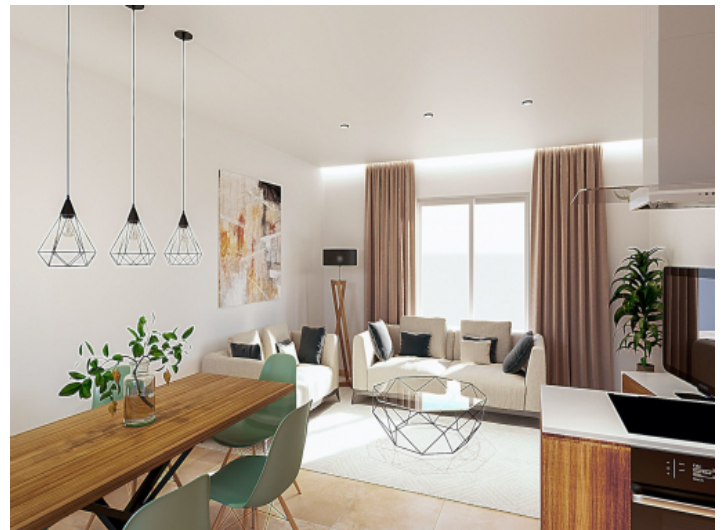
Offener Wohn- und Essbereich