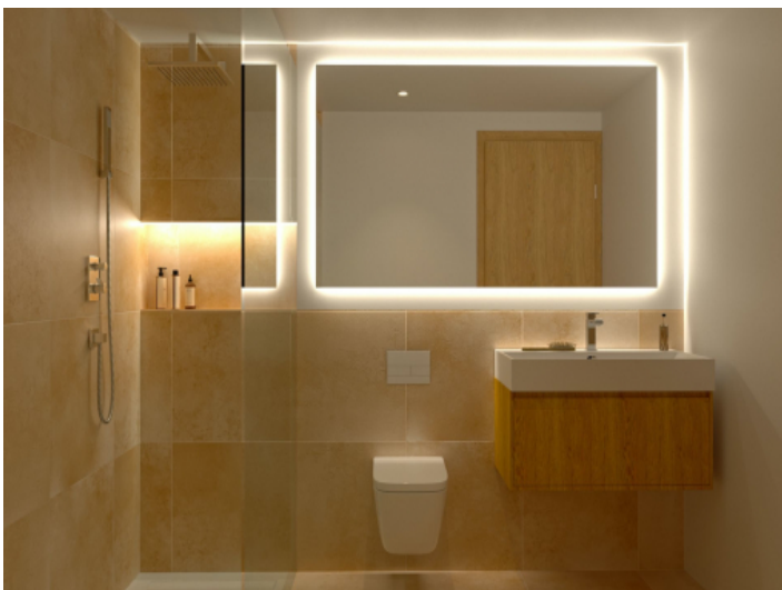
Badezimmer mit ebenerdiger Dusche