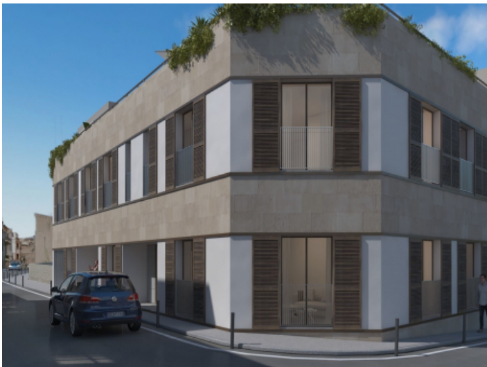
Erdgeschoss Wohnung in Palma