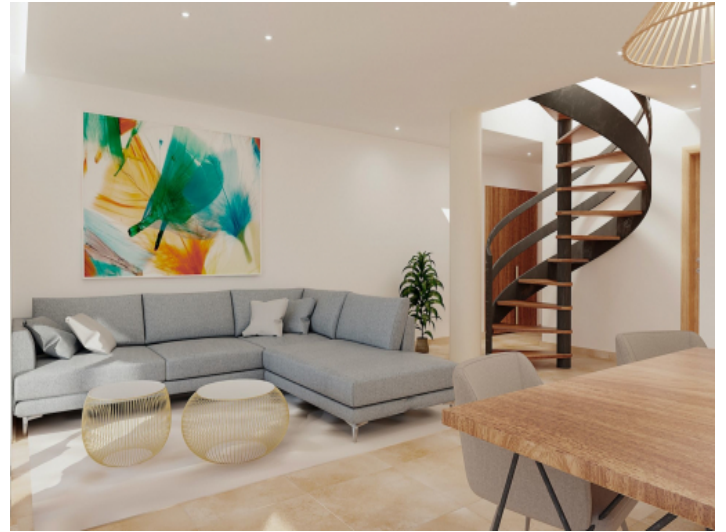
Offener Wohn- und Essbereich