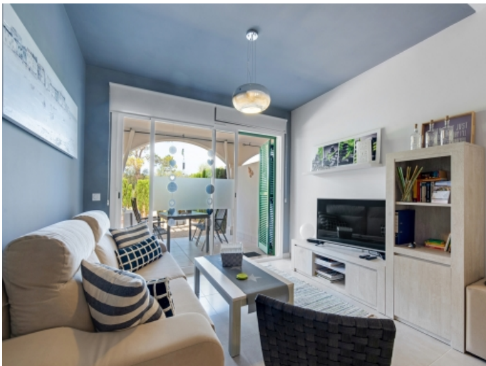
Offener Wohn und Essbereich