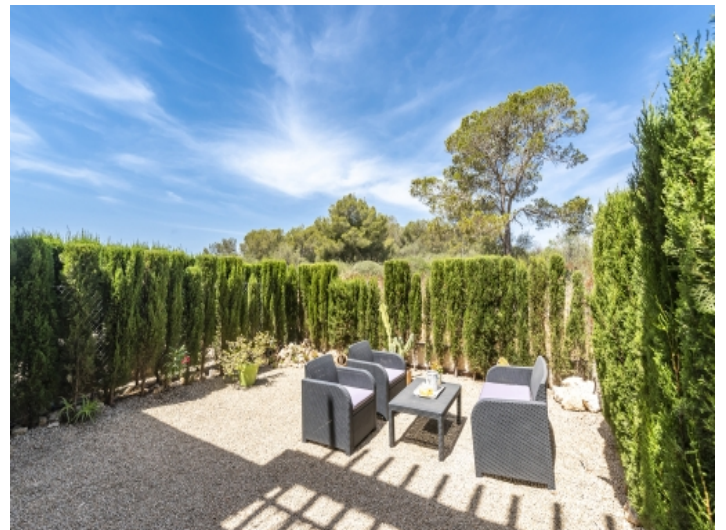
Großer Garten der Wohnung