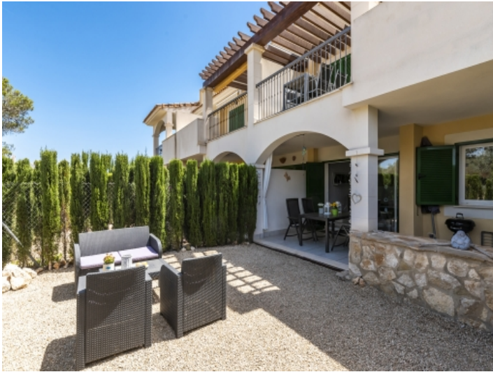
Schöner Garten der Wohnung