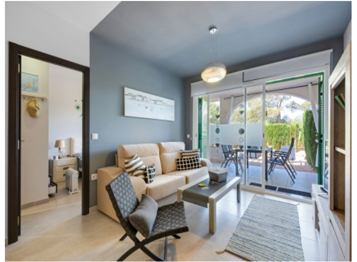
Offener Wohn und Essbereich