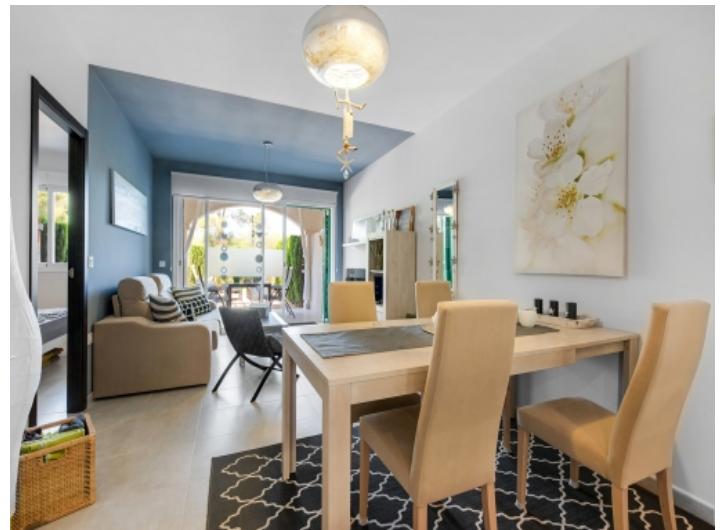
Offener Wohn und Essbereich