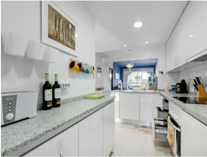
Moderne, voll ausgestattete Küche