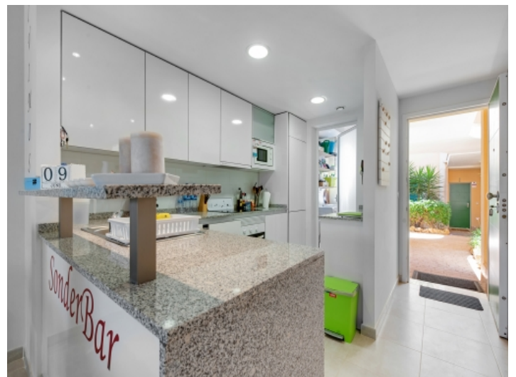
Moderne, voll ausgestattete Küche