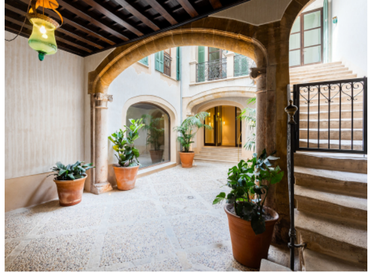
Bezaubernder Mallorquinischer Patio