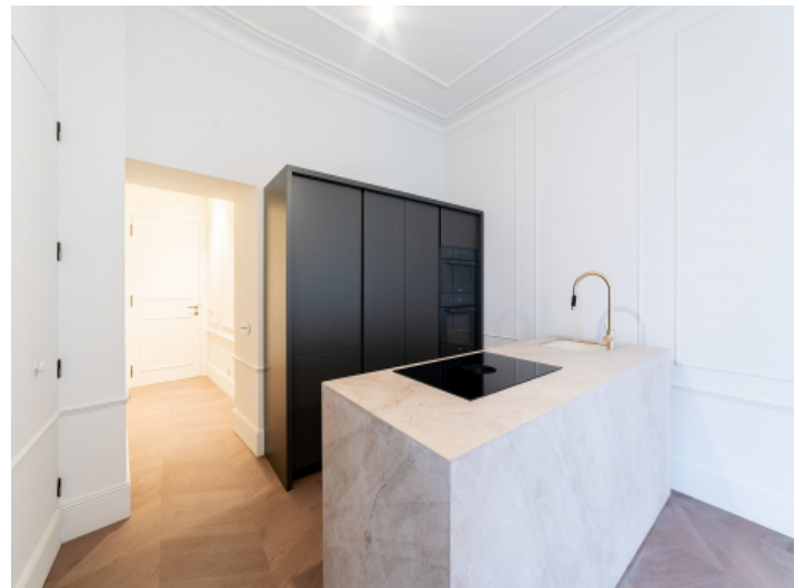
Moderne, hochwertige Küche