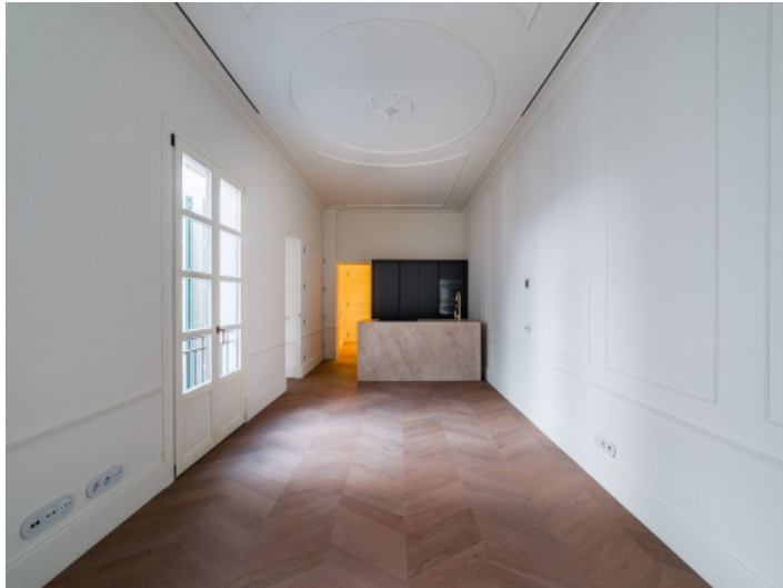
Wohnbereich mit offener Küche