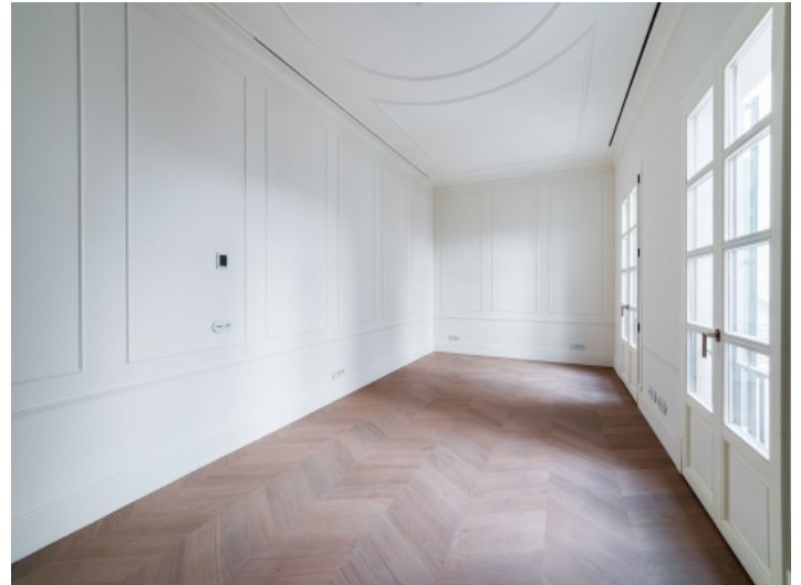
Wohnbereich mit weißen Wänden