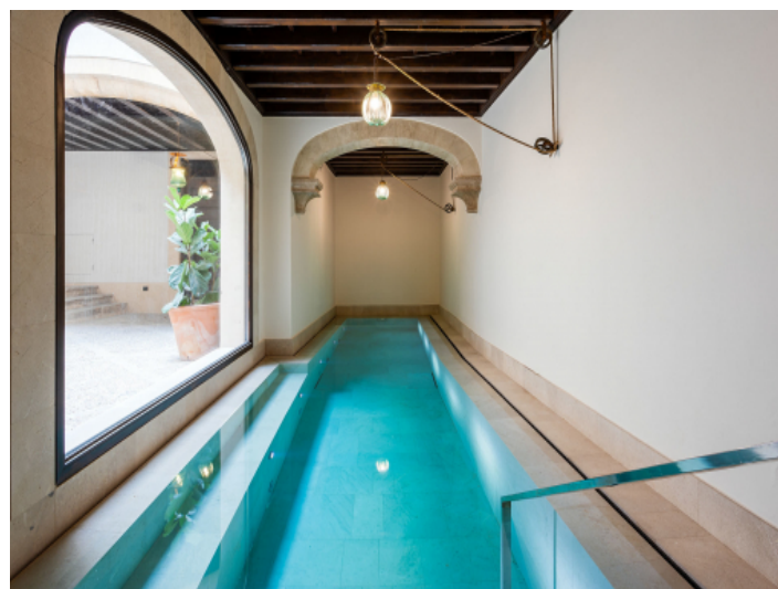
Gemeinschaftspool im Erdgeschoss