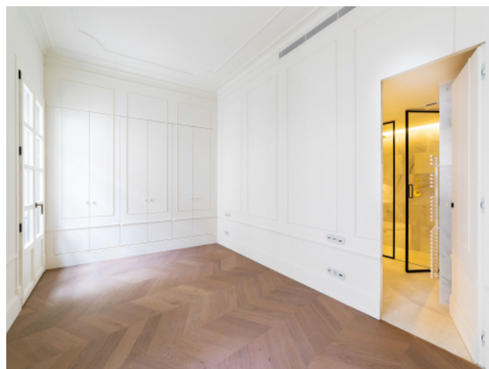
Schlafzimmer mit Badezimmerzugang