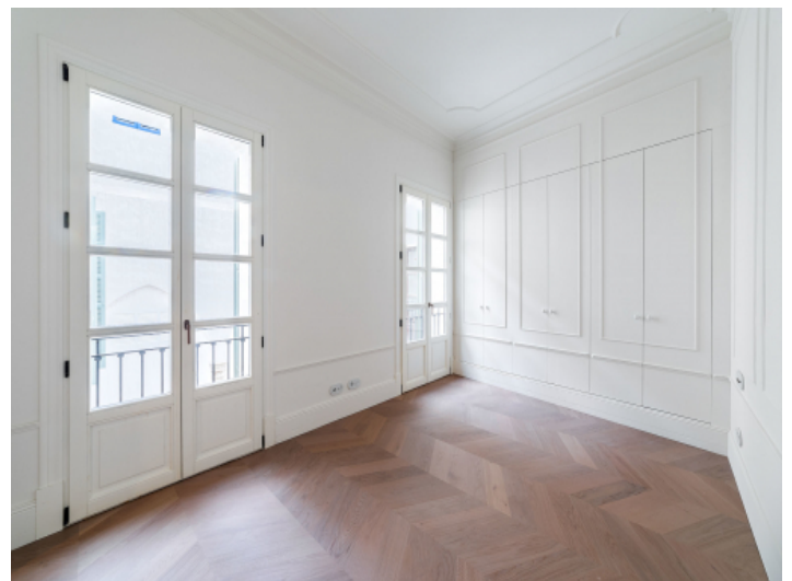
Schlafzimmer mit Einbauschränken