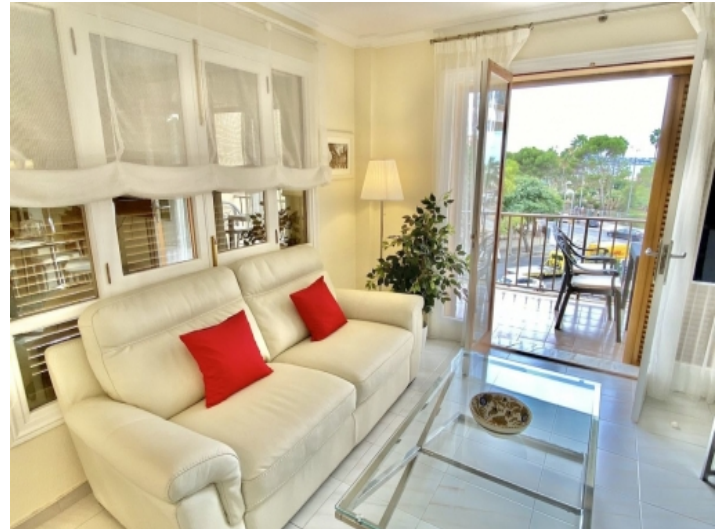
Wohnbereich mit Balkonzugang