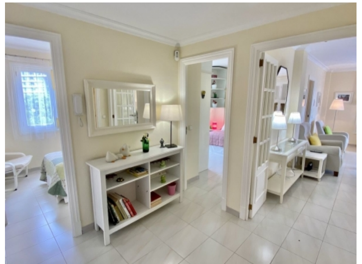
Ansicht des Flurs