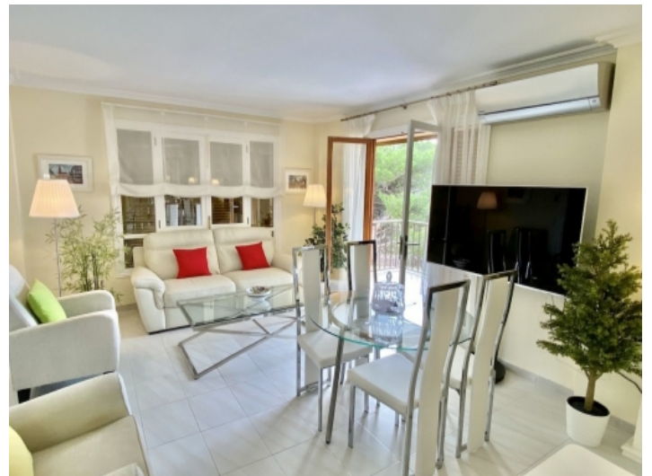
Großzügiger Wohn-und Essbereich