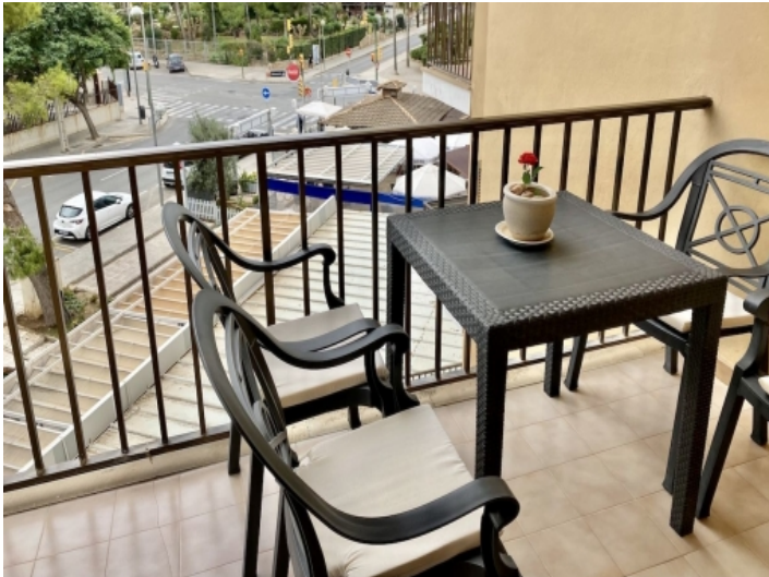
Balkon mit Meerblick