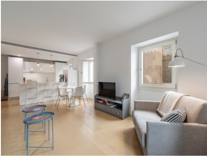
Großer Wohn-und Essbereich