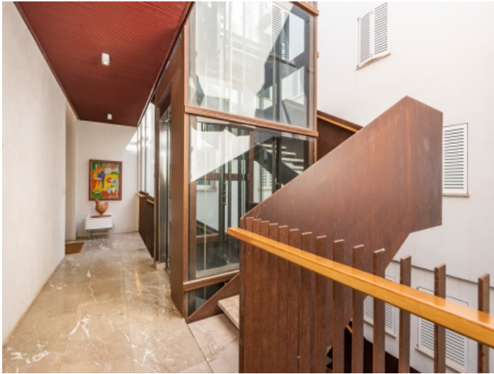
Zugang zur Wohnung