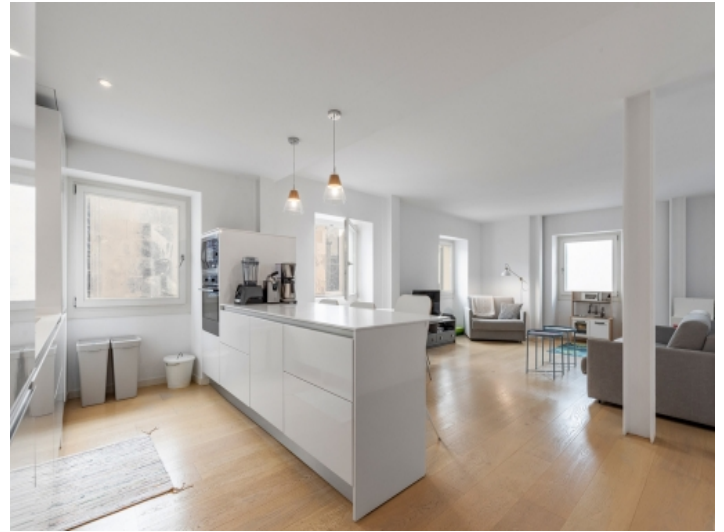
Offene Küche mit Kochinsel