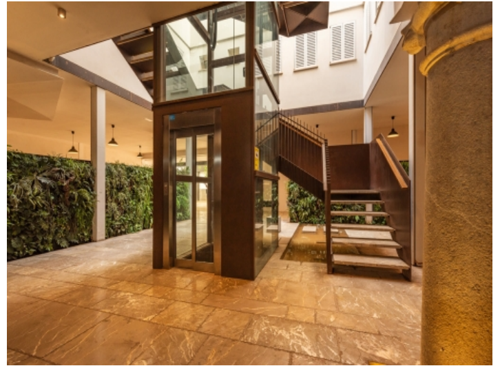
Eingangshalle mit eleganter Treppe