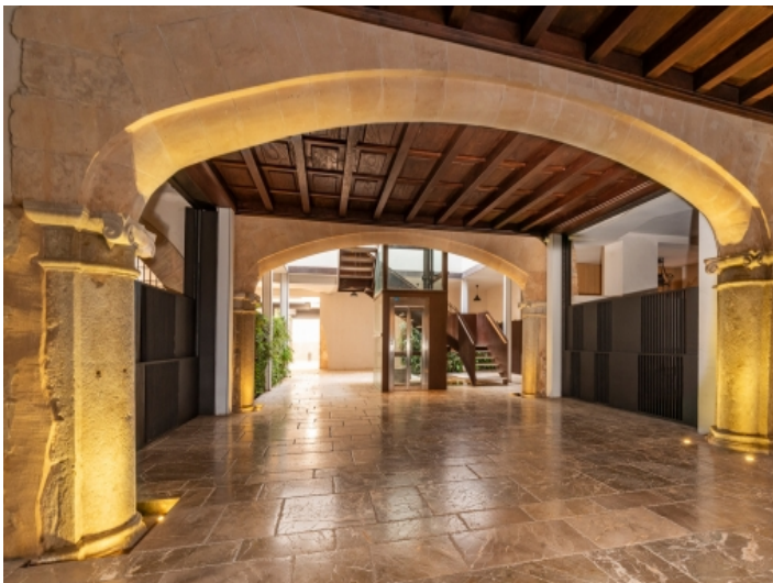
Beeindruckende Eingangshalle mit Steinbogen