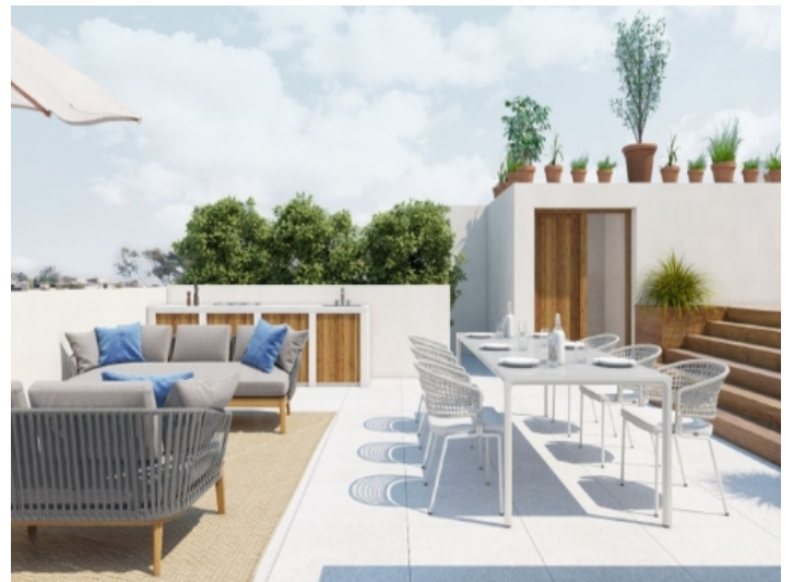
Lounge Terrasse und Essbereich