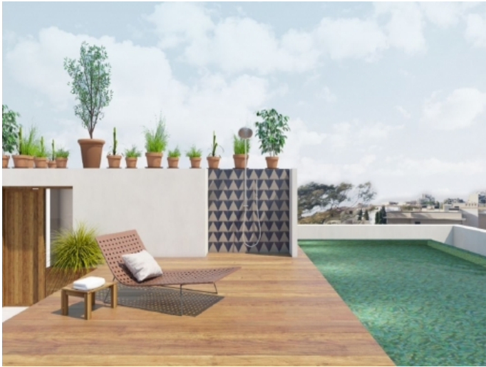
Pool und Sonnenterrasse