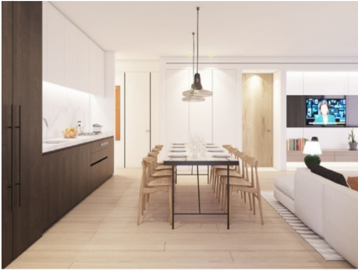
Essbereich und Küche