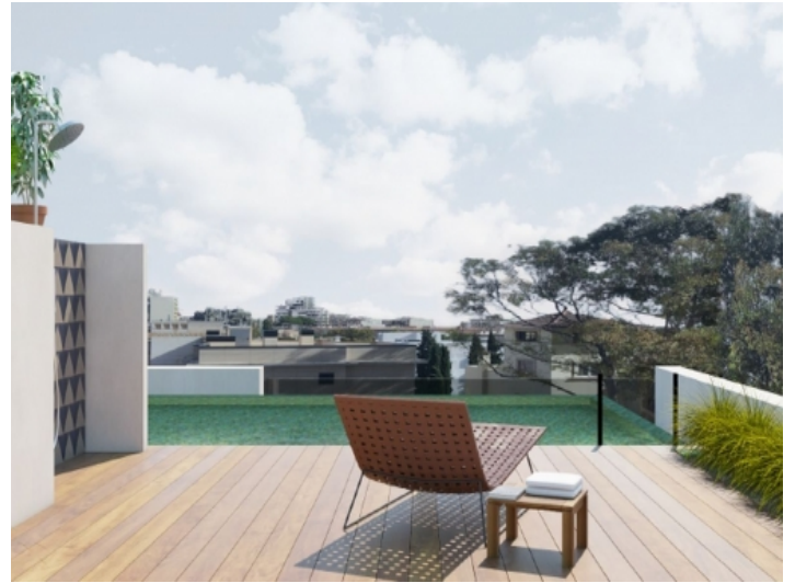
Pool und Sonnenterrasse