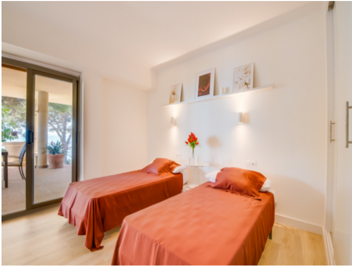
Eines von 4 Schlafzimmern