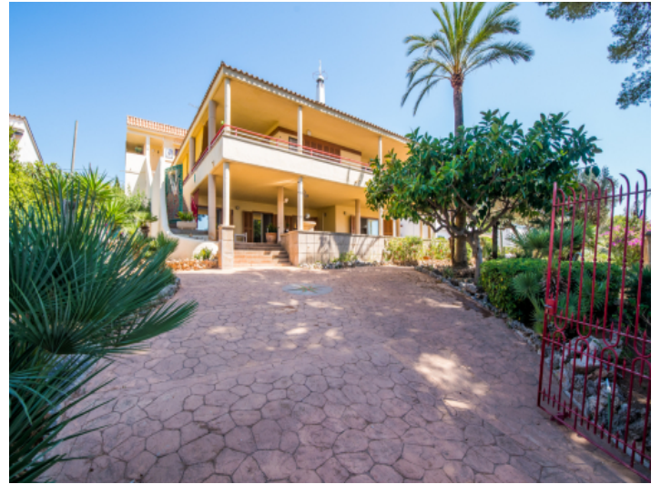
Zugang zum Haus