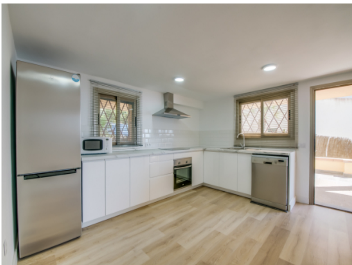
Voll ausgestattete Küche