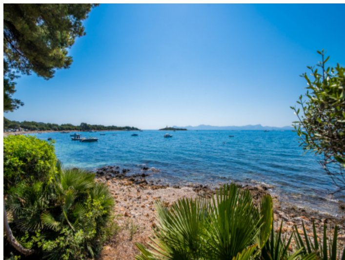
Blick auf das Meer