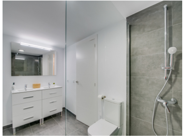
Badezimmer mit Dusche