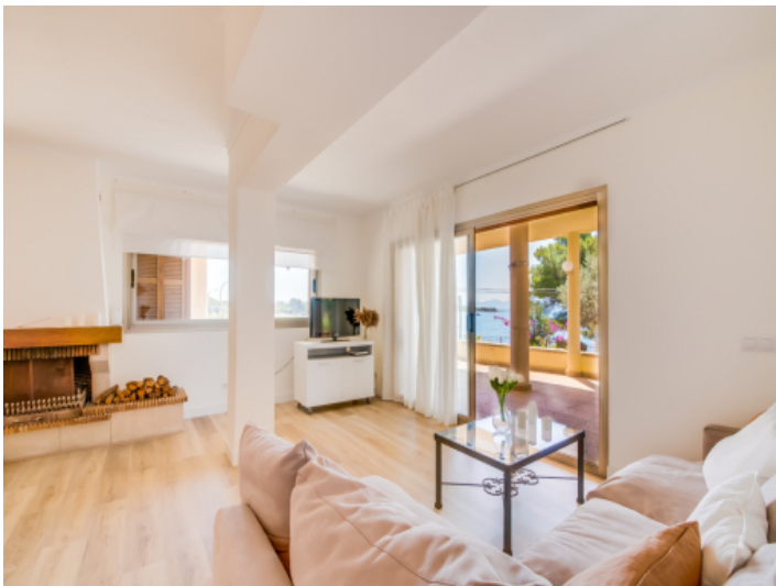
Wohnbereich mit einem Ausblick