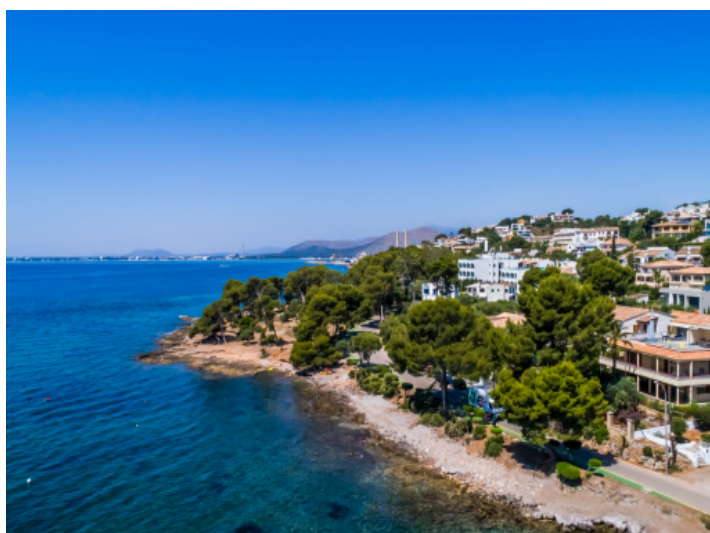
Blick auf das Meer