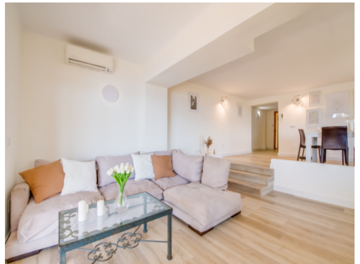
Wohn- und Essbereich