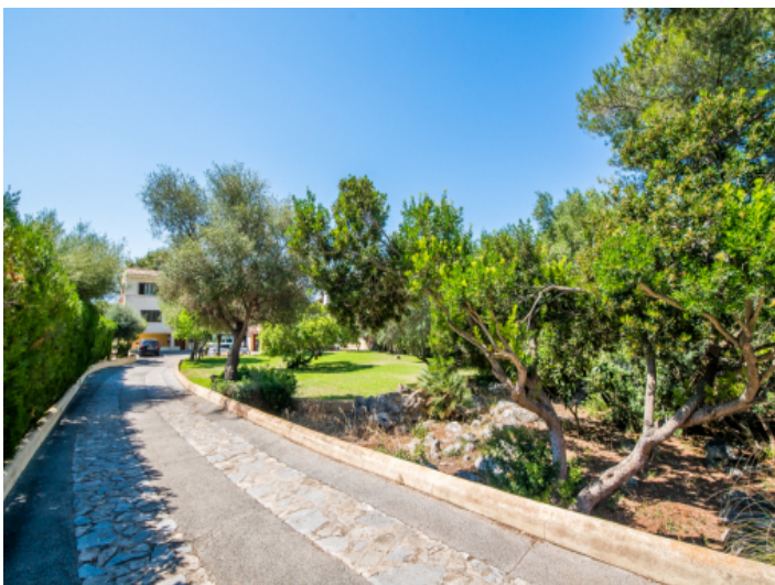
Ansicht der Auffahrt