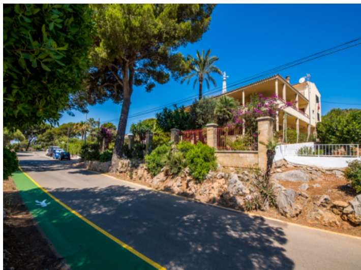
Außenansicht des Hauses