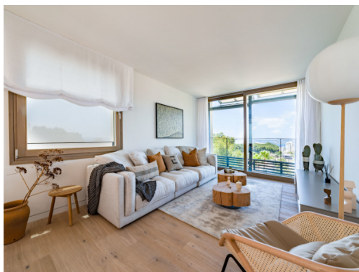
Lichtdurchfluteter Wohnbereich und Balkon mit Meerblick