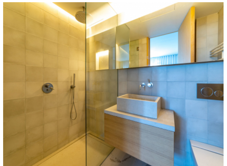
Nobles Badezimmer mit ebenerdiger Dusche