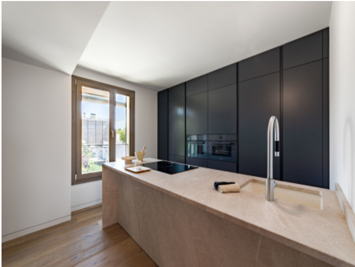
Voll ausgestattete Küche mit Kochinsel