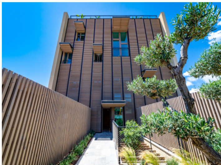
Außenansicht des Gebäudes