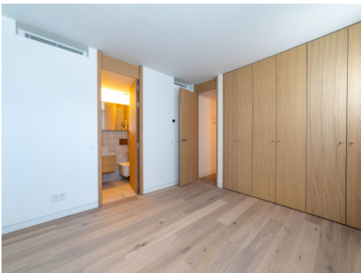
Geräumiges Doppelschlafzimmer mit Badezimmer en Suite