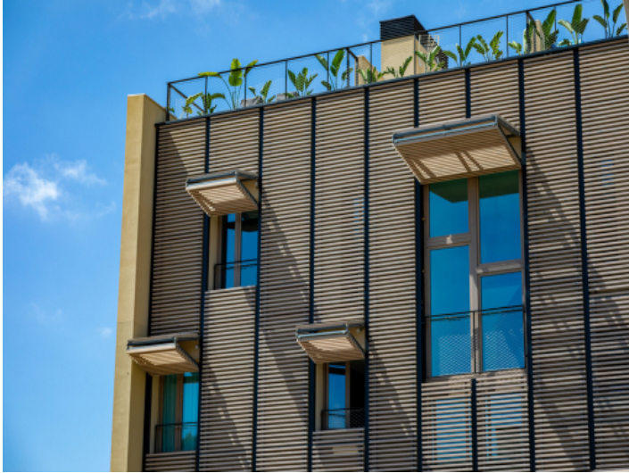
Außenansicht von der Straße