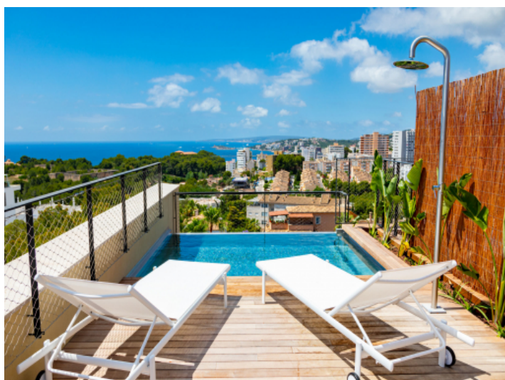
Malerische Dachterrasse mit Pool