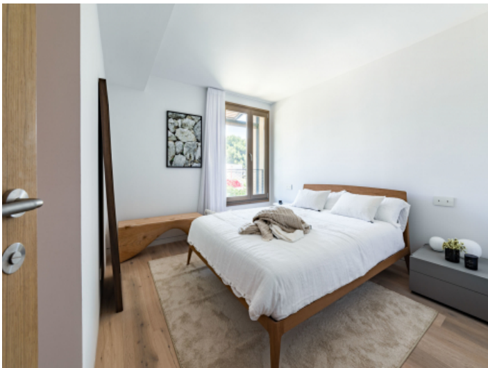
Geräumiges Doppelschlafzimmer mit Badezimmer en Suite