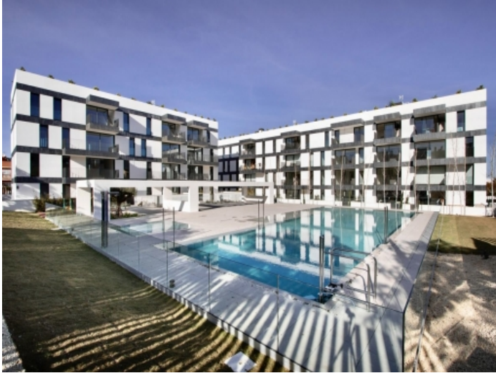
Komplex mit Gemeinschaftspool