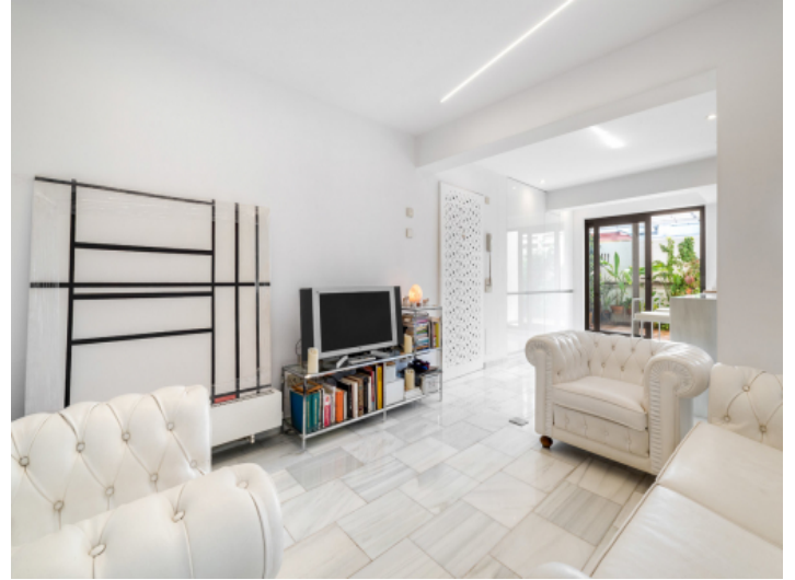
Angrenzender, offener Wohnbereich