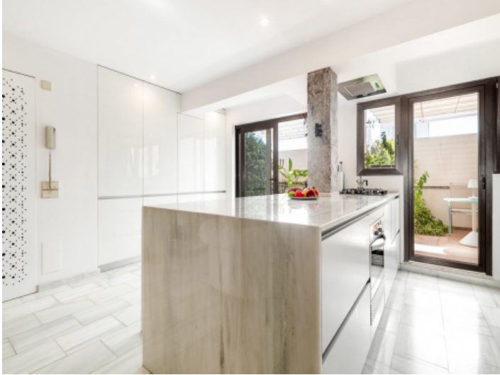
Moderne Küche mit Terrassenzugang