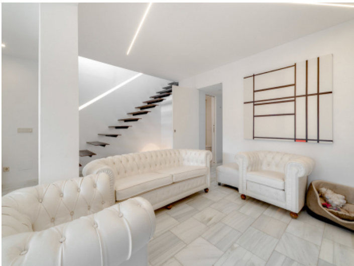
Wohnbereich mit Treppe ins Obergeschoss