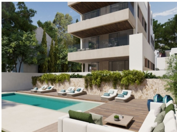
Ansicht des Gemeinschaftspools