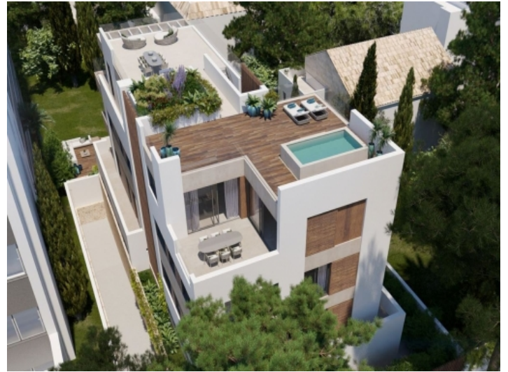
Außenansicht des Wohnkomplexes