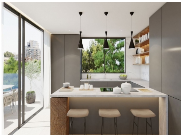
Moderne Küche mit Kochinsel