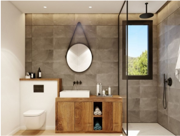
Mit Tageslicht geflutetes Badezimmer