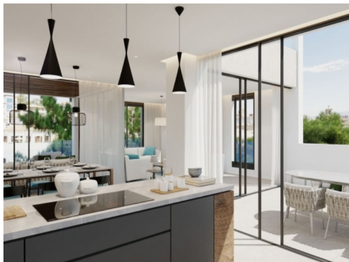
Zugang zum Balkon