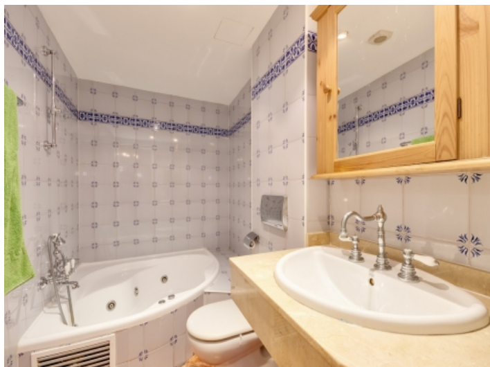
Badezimmer mit Wanne