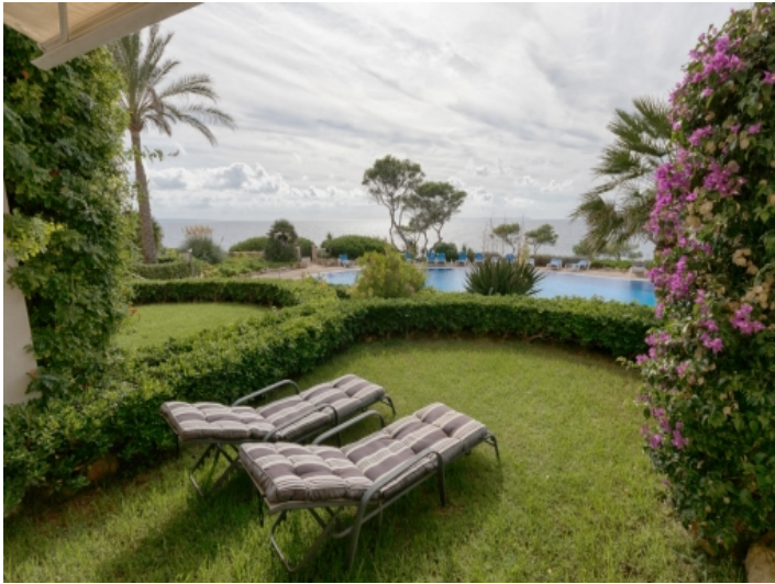
Garten mit Meerblick