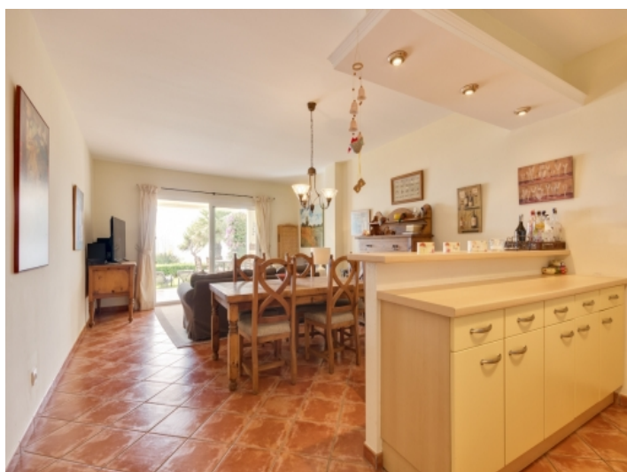
Wohn-und Essbereich mit Gartenzugang