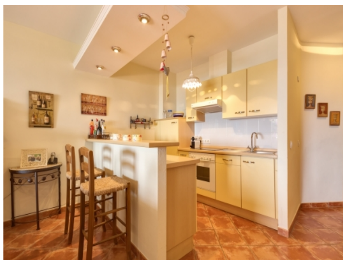
Offene Küche mit Bartisch