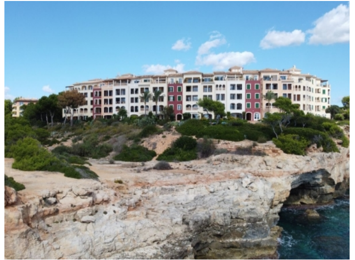
Außenansicht des Wohnhauses