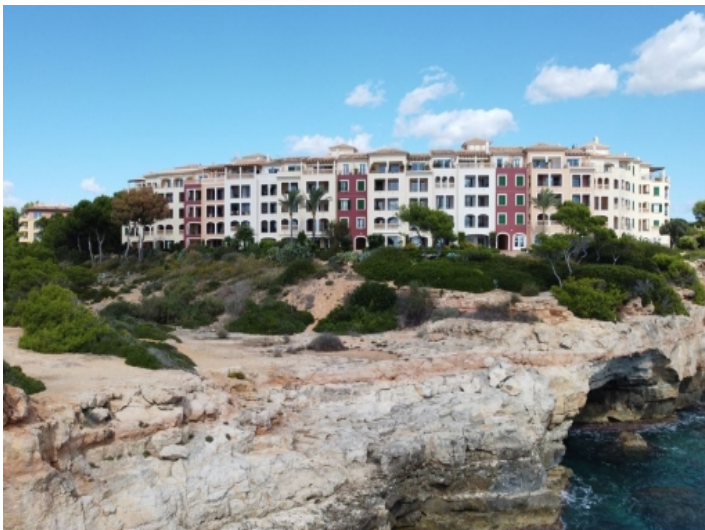
Außenansicht des Wohnhauses