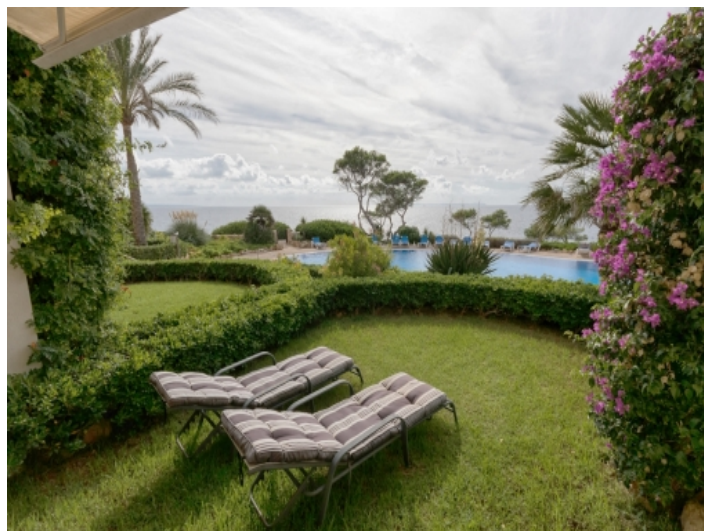
Garten mit Meerblick