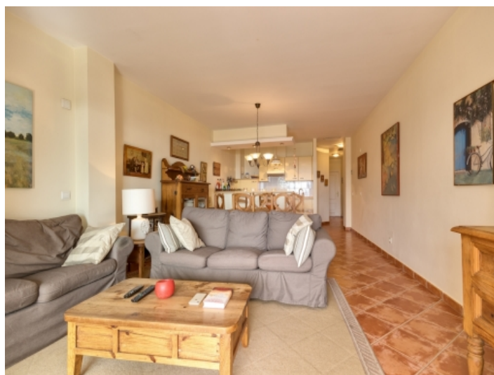
Schöner Wohn-und Essbereich