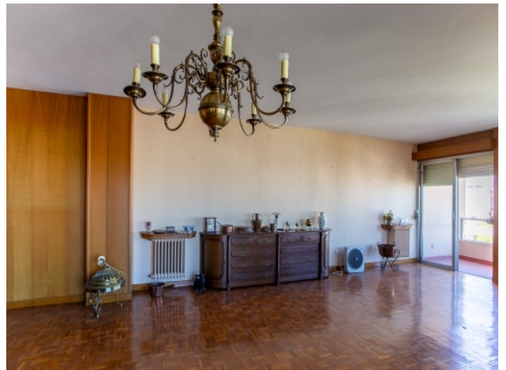
Ausreichend Platz für einen offenen Wohn-Essbereich