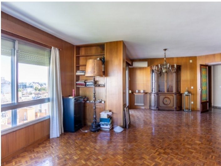
Alternative Ansicht des Wohnbereichs