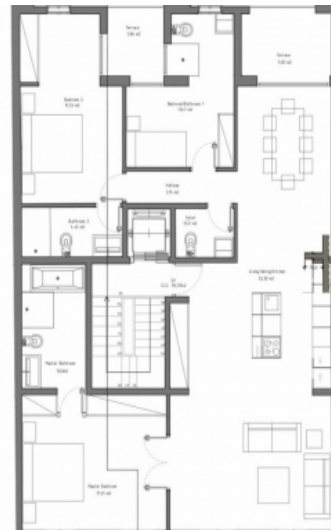
Grundriss der Wohnung