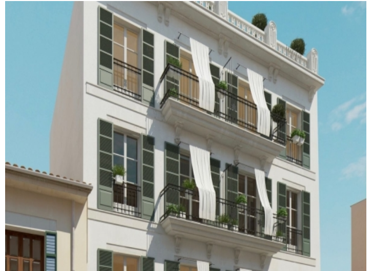
Außenansicht des Gebäudes