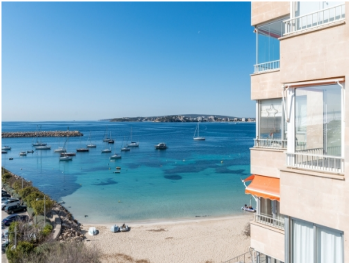
Strand direkt vor dem Wohngebäude