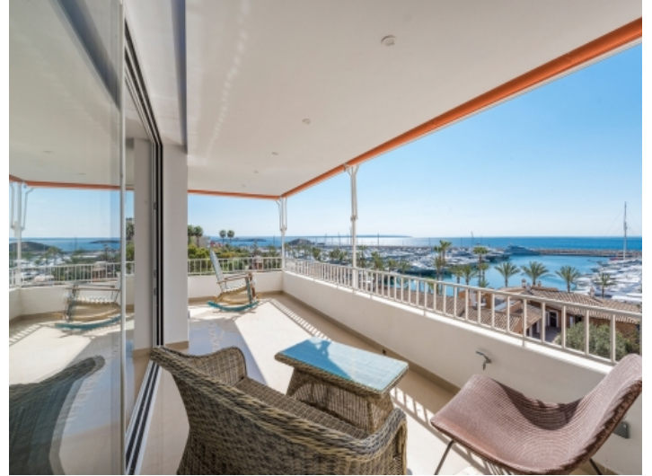
Chill-out Bereich auf dem Balkon