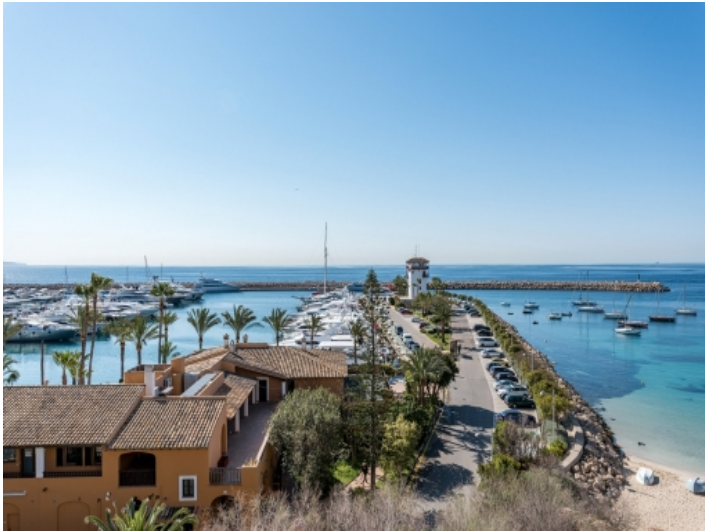
Atemberaubender Meerblick vom Apartment