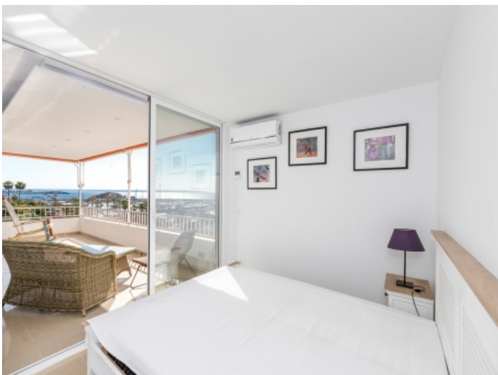
Hauptschlafzimmer mit Balkonzugang