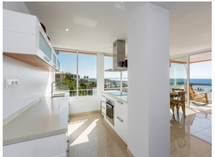
Voll ausgestattete, offene Küche