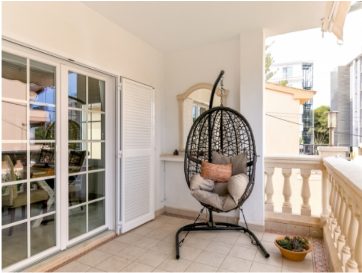
Die kleine Terrasse lädt ein zum Entspannen