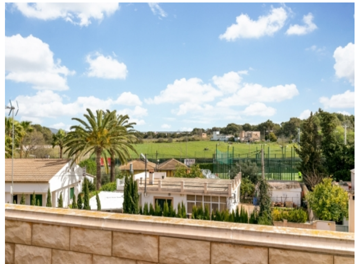
Die Wohnung liegt in einer ruhigen Umgebung