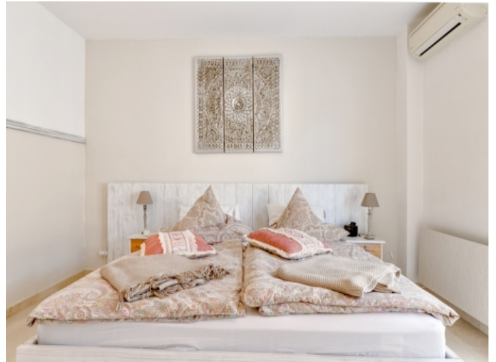
Das Schlafzimmer verfügt über Klimaanlage