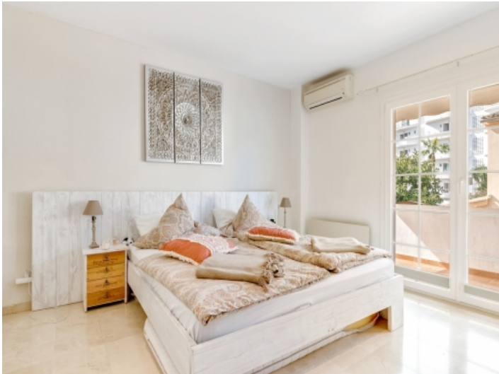
Komfortables Doppelschlafzimmer mit Terrassenzugang