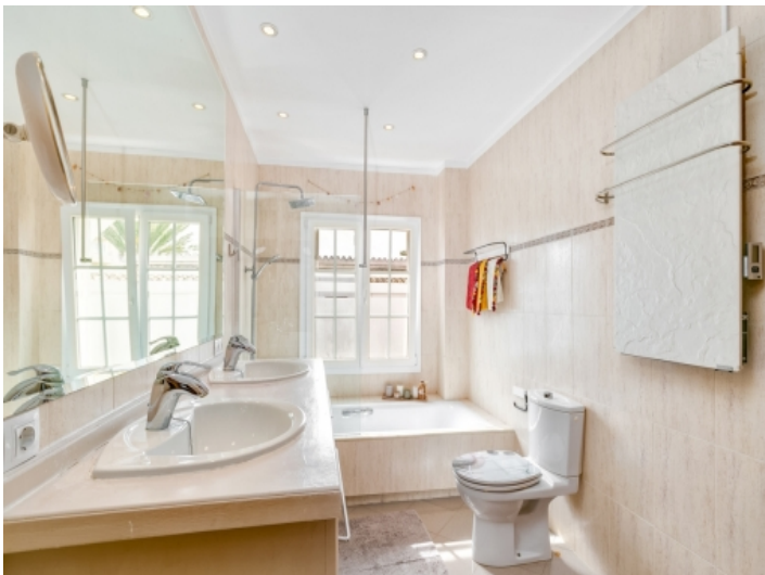
Badezimmer mit Badewanne und Tageslicht