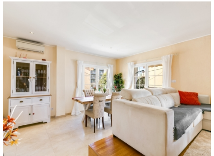
Die Wohnung strahlt eine Wohlfühl-Atmosphäre aus