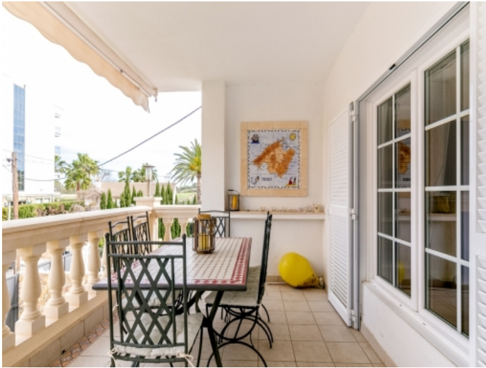
Überdachte Terrasse mit Essbereich angrenzend an den