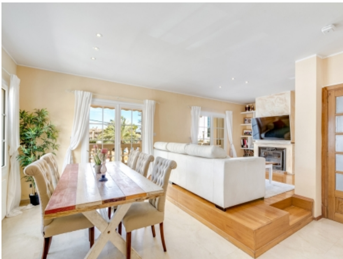
Heller und großzügiger Wohn-und Essbereich mit