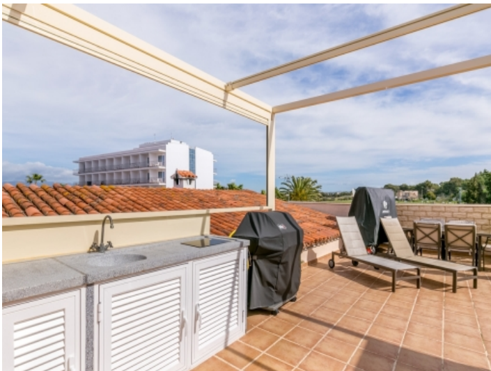
Fantastische Dachterrasse mit Außenküche und Sonnenliegen