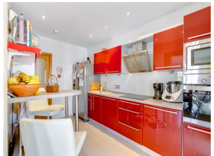
Moderne und voll ausgestattete Küche