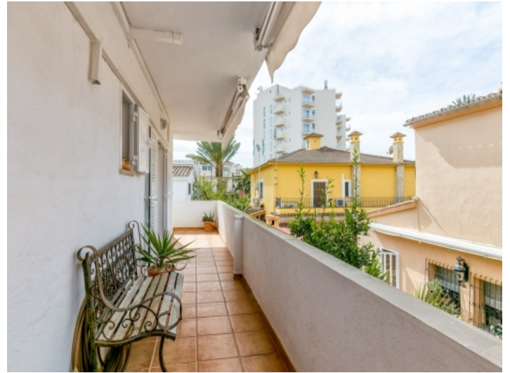
Eine herrliche Terrasse umgibt die Wohnung