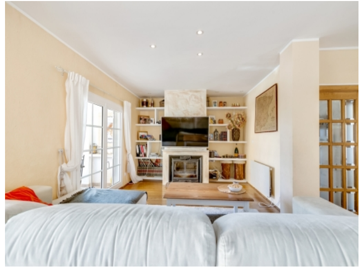
Gemütlicher Wohnbereich mit Kamin