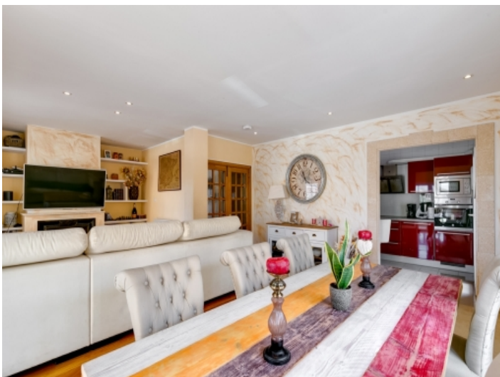
Blick vom einladenden Essbereich in die Küche