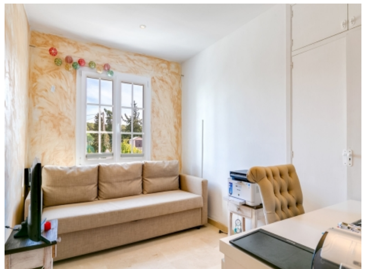
Helles Schlafzimmer oder Büro