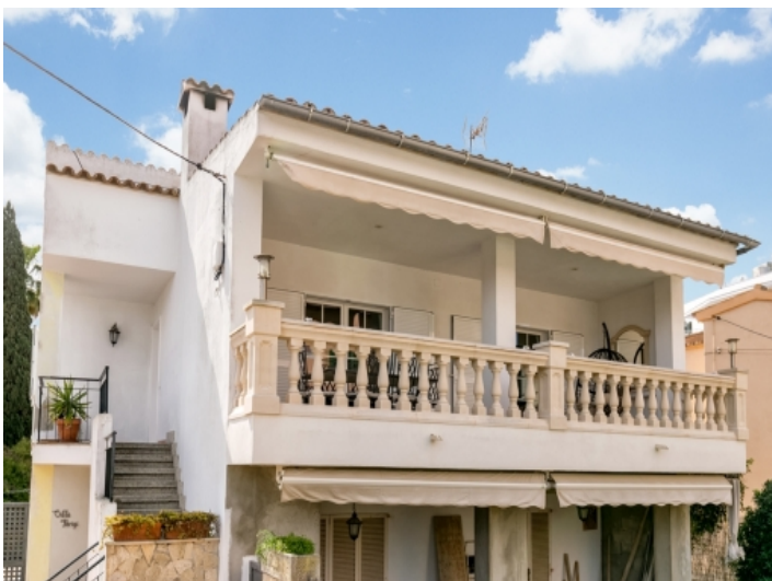
Außenansicht der wundervollen Wohnung