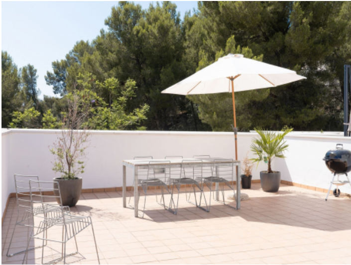
Großer Essbereich Terrasse