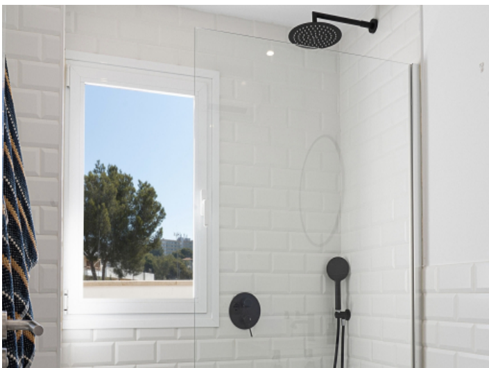
Helles Bad mit Fenster