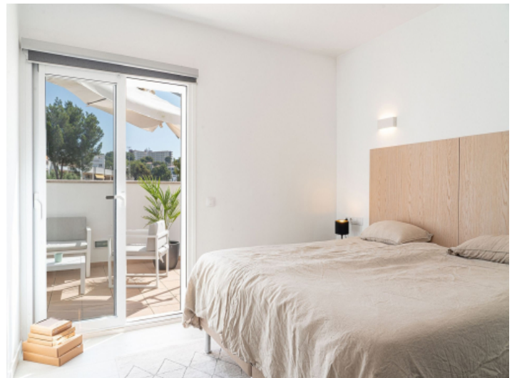
Schlafzimmer mit Terrassenzugang